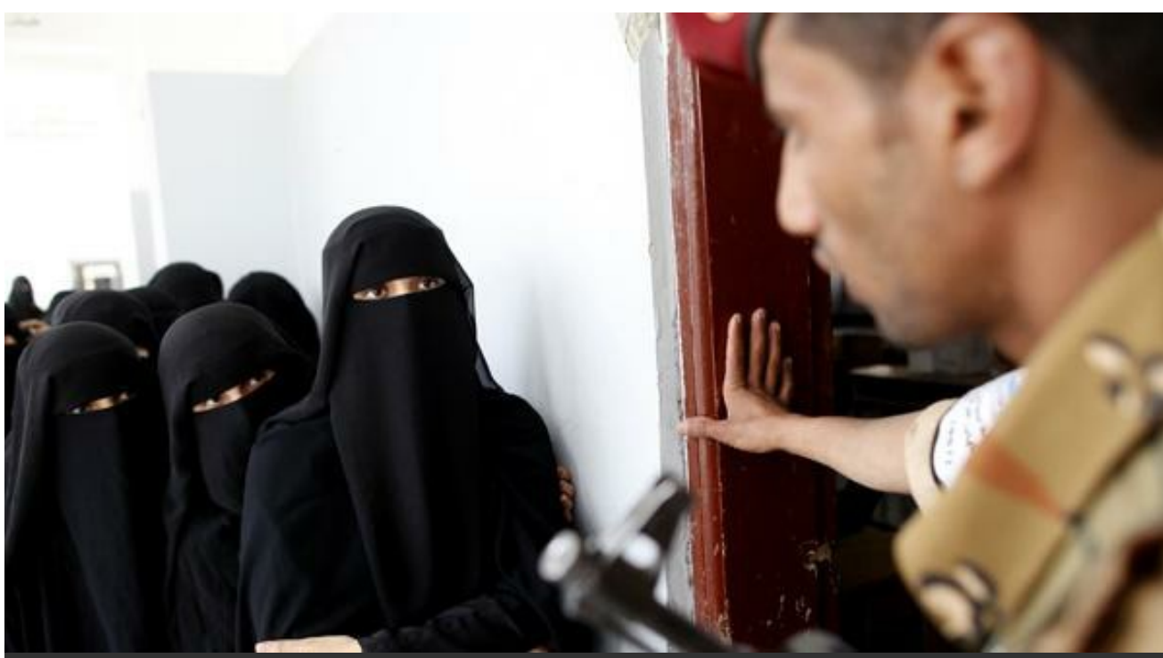
A Sanaa, au Yémen, le 21 février 2012 dans un bureau de vote.

C'est une bonne question : pourquoi donc les hommes ne seraient-ils pas eux aussi des objets de tentation qu'il faudrait soustraire au désir affolant des femmes ? Hind Aleryani, journaliste et écrivaine yéménite la pose, avec provocation et humour, dans son blog .