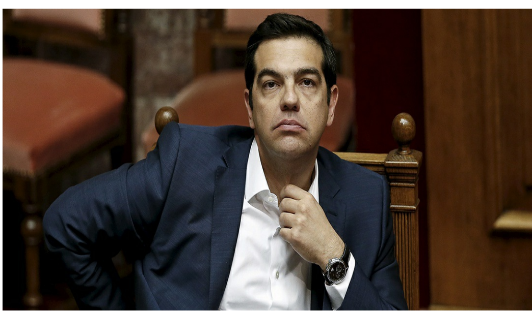
Alexis Tsipras, le 5 juin 2015.

Jean-Marie Colombani | Economie | Monde | 29.06.2015 - 12 h 42 | mis à jour le 29.06.2015 à 12 h 43