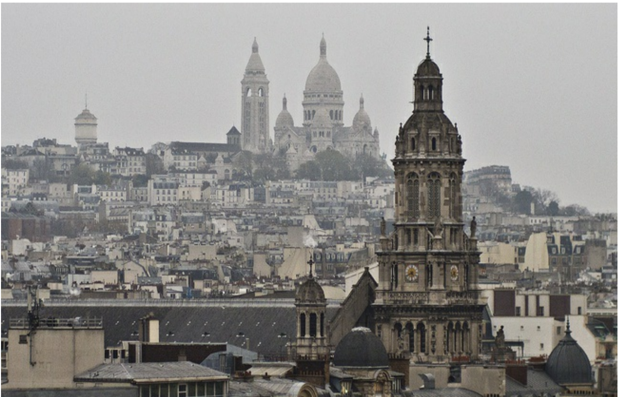
Illustration de Montmartre à Paris, le 4 décembre 2014.