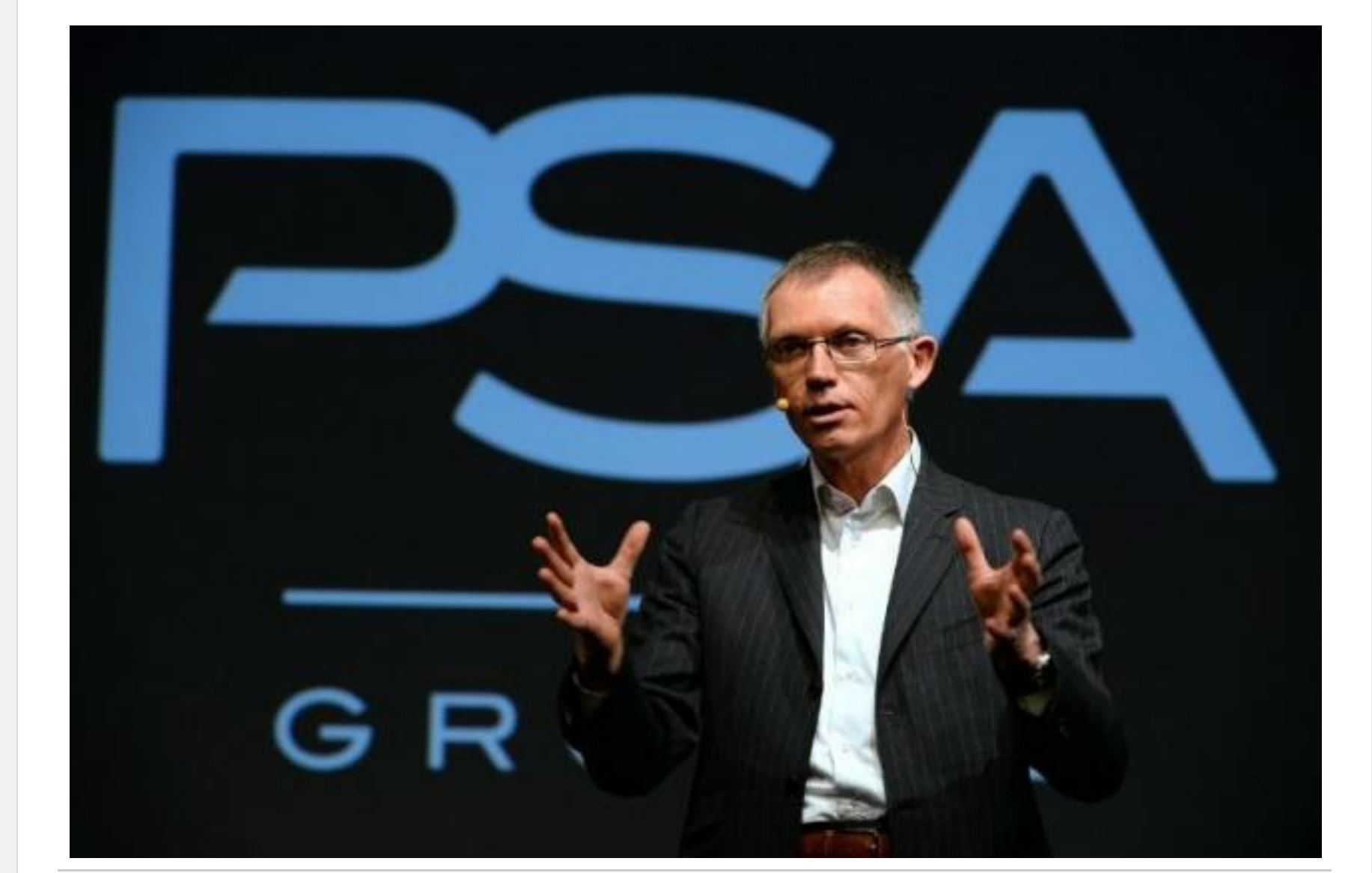
Le président du directoire de PSA Peugeot Citroën Carlos Tavares (archive)

L'assemblée générale annuelle du groupe automobile a approuvé l'augmentation de la rémunération du président du directoire qui avait fait polémique fin mars.