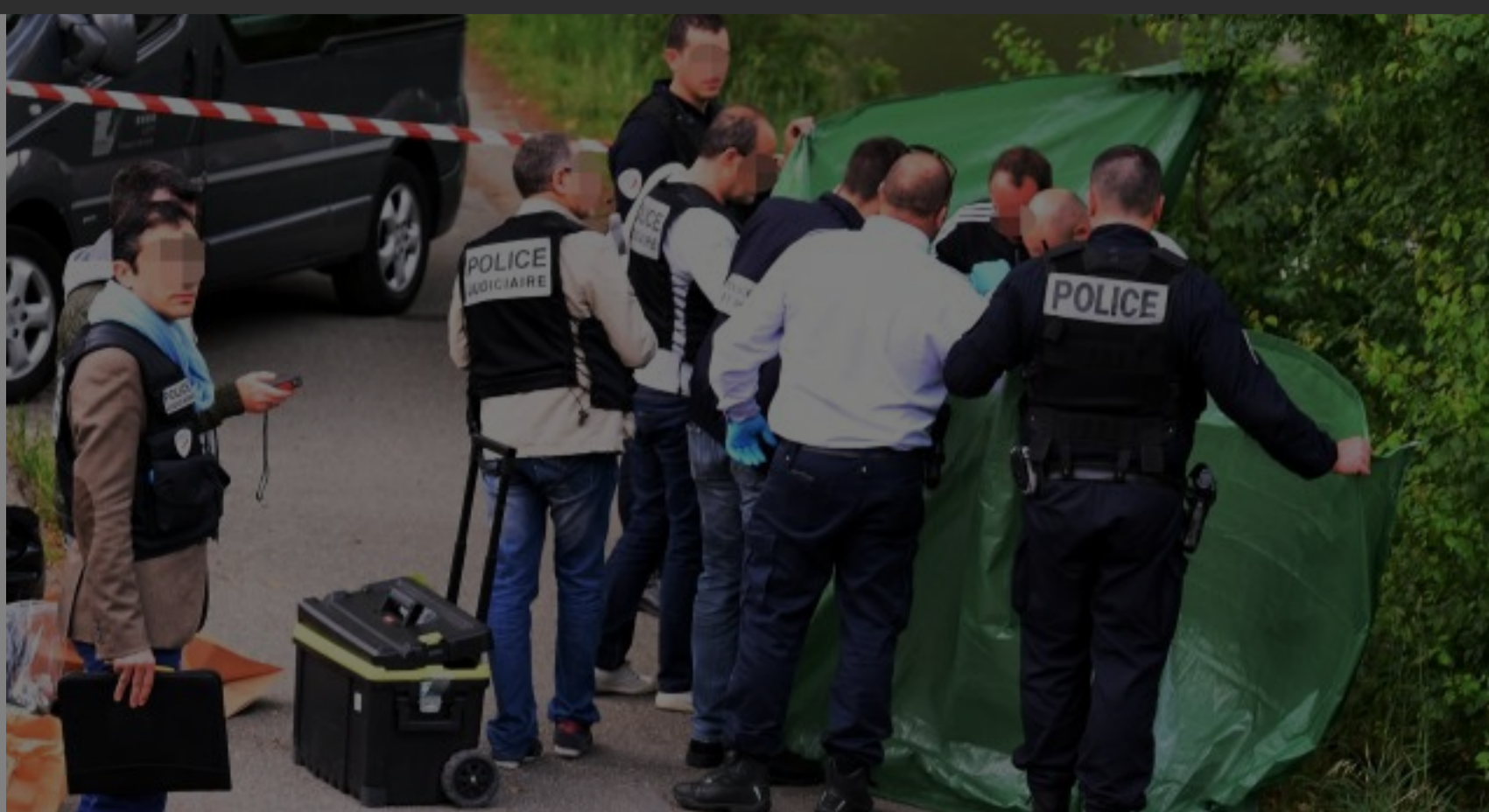
Lors de la découverte de la première jambe

FRANCE TELEVISIONS, en sa qualité de responsable du traitement, collecte vos données à caractère personnel à des fins de gestion de votre compte utilisateur. Ces données sont nécessaires pour pouvoir vous offrir un espace personnalisé. Conformément à la loi Informatique et libertés du 6 janvier 1978, vous bénéficiez d'un droit d'accès, de rectification et de suppression de vos données. Vous pouvez également vous opposer, pour un motif légitime, à l'utilisation de vos données. Vous seul pouvez exercer ces droits sur vos propres données en écrivant à France Télévisions - Editions Numériques Service Inscription Internet - 7 Esplanade Henri de France 75015 Paris et en joignant une photocopie de votre pièce d'identité