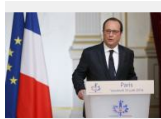
1 / 1 Plein écran

PARIS (Reuters) - François Hollande a pris acte vendredi du choix des Britanniques de sortir de l'Union européenne, qui met "l'Europe à l'épreuve" et appelle selon lui des changements profonds sous peine de voir "la dilution et le repli" l'emporter.