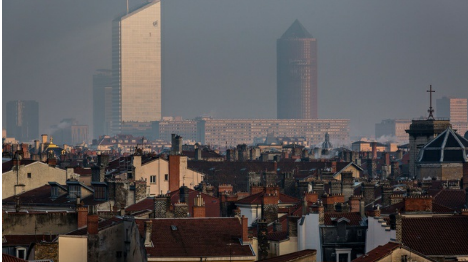
Vue de Lyon ces derniers jours, lors du pic de pollution aux particules fines.