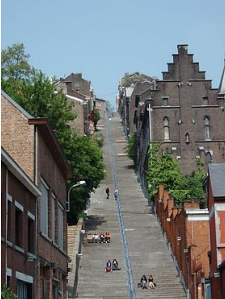
Les escaliers de la montagne de Bueren