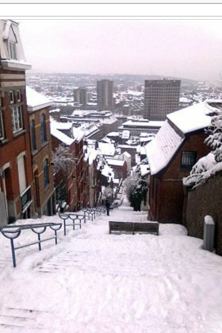
Montagne de Bueren sous la neige.

Sur les autres projets Wikimedia : Montagne de Bueren ( https://commons.wikimedia.org/wiki/Category:Montagne_de_Bueren?uselang=fr ), sur Wikimedia Commons