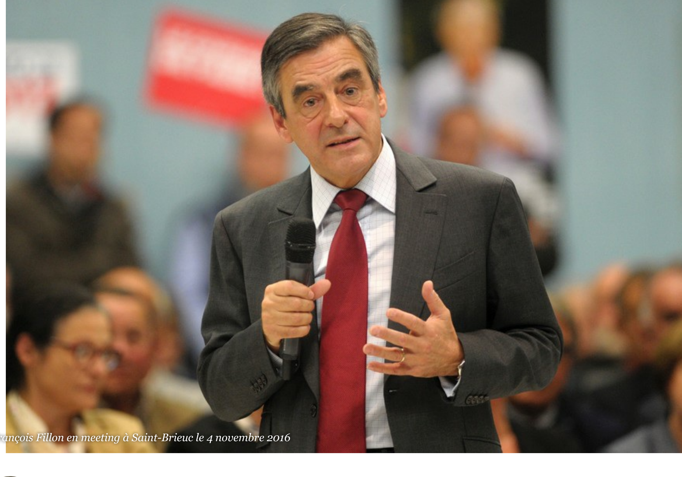
François Fillon en meeting à Saint-Brieuc le 4 novembre 2016

CONFIDENTIELS RTL - Le candidat à la présidentielle souhaite aider cette personnalité qui "ne peut s'acquitter des frais" d'un traitement.