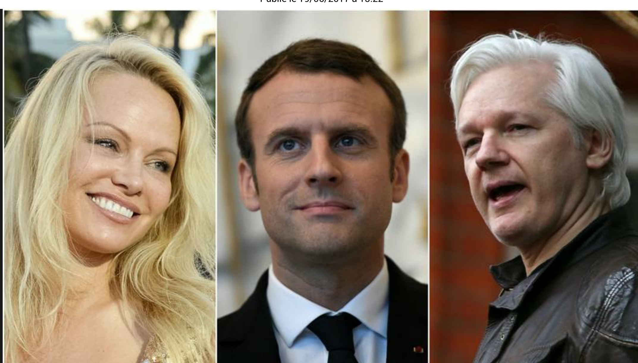
Pamela Anderson veut obtenir d'Emmanuel Macron l'asile politique du cybermilitant australien.

Dans une tribune publiée sur le blog de sa fondation, l'actrice d'Alerte à Malibu a convié le président de la République à l'ouverture de son restaurant varois pour lui demander notamment l'asile politique du fondateur de WikiLeaks.