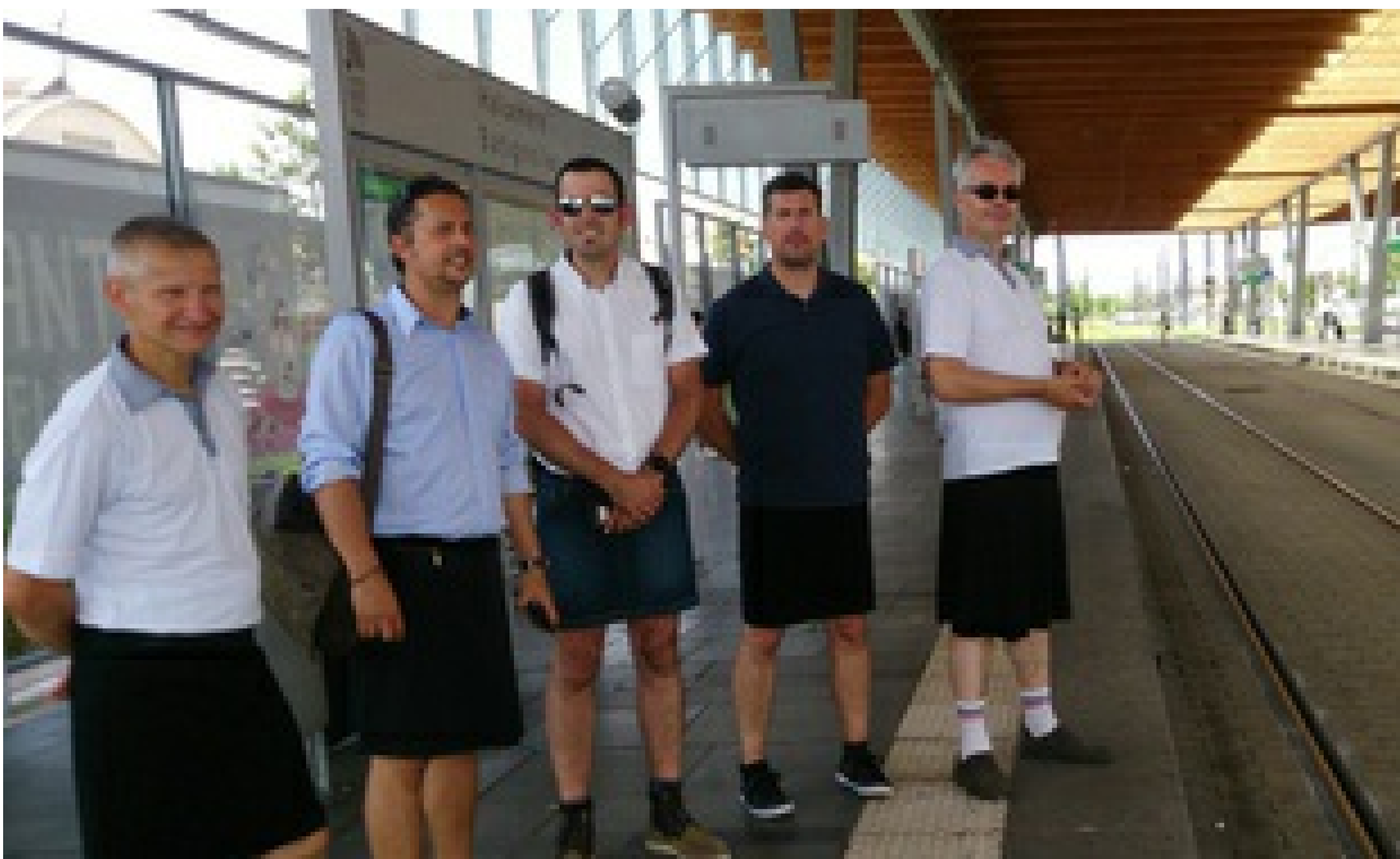
A Nantes, des conducteurs sont venus en jupe — CFDT Semitan

J.U. | Publié le 21/06/17 à 10h41 — Mis à jour le 21/06/17 à 10h46