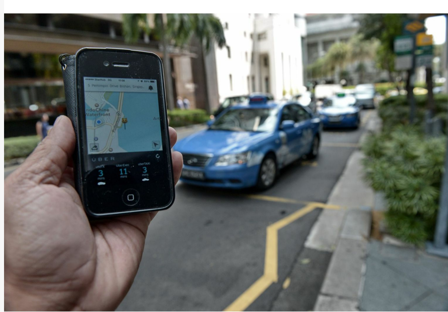
Une personne utilise avec son smartphone l'application Uber, le service américain de voitures avec chauffeur (VTC), le 10 octobre 2014 à Singapour.

D'après Les Echos, le service pourrait être lancé dans la capitale "avant le 30 septembre, avec l'ambition de bousculer les autres plateformes, à commencer par le leader Uber". Déjà présent depuis le 4 septembre à Londres, Taxify et Didi passent donc la seconde.