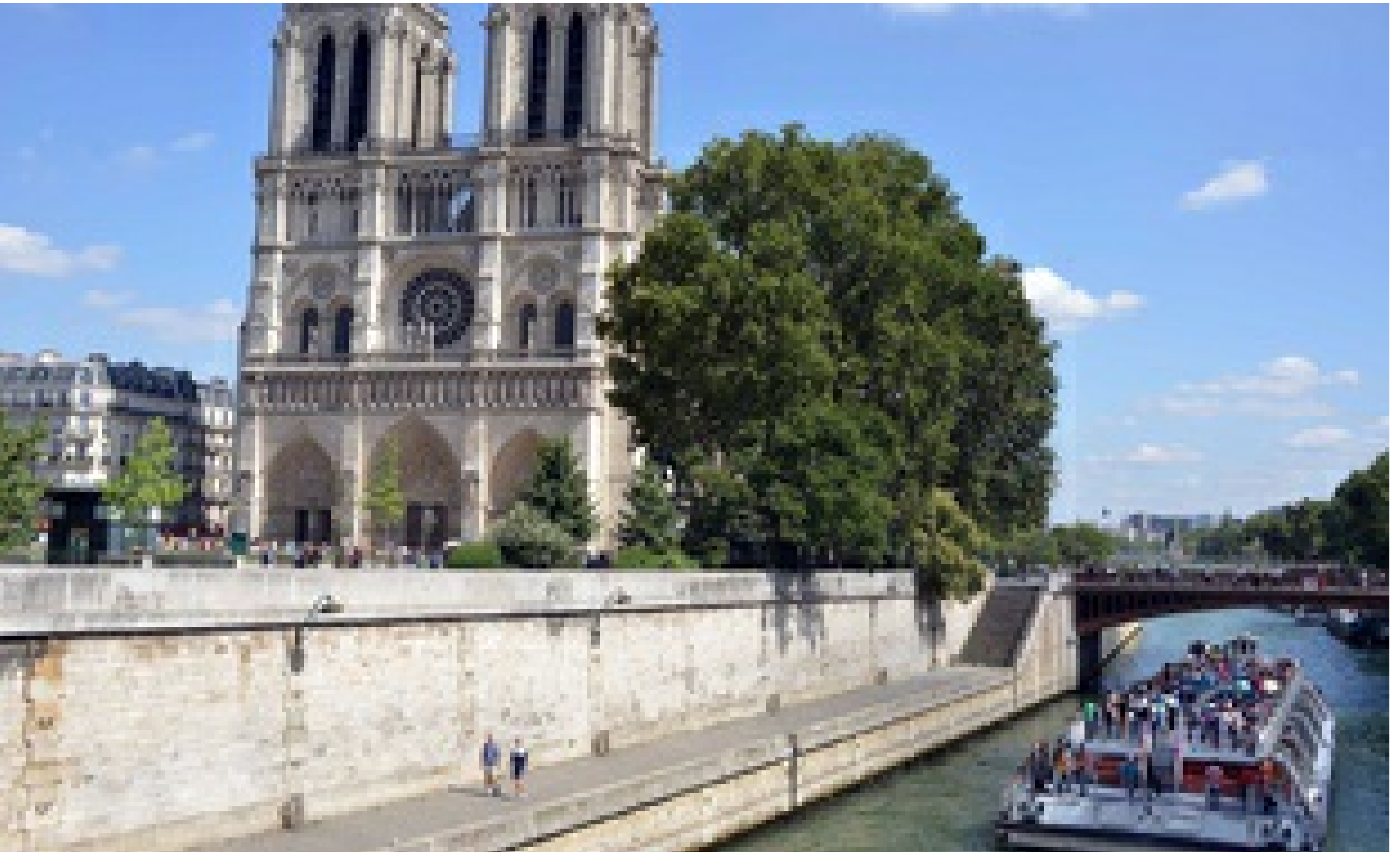
Paris a un nouvel archevêque.

20 Minutes avec AFP | Publié le 07/12/17 à 11h45 — Mis à jour le 07/12/17 à 11h45