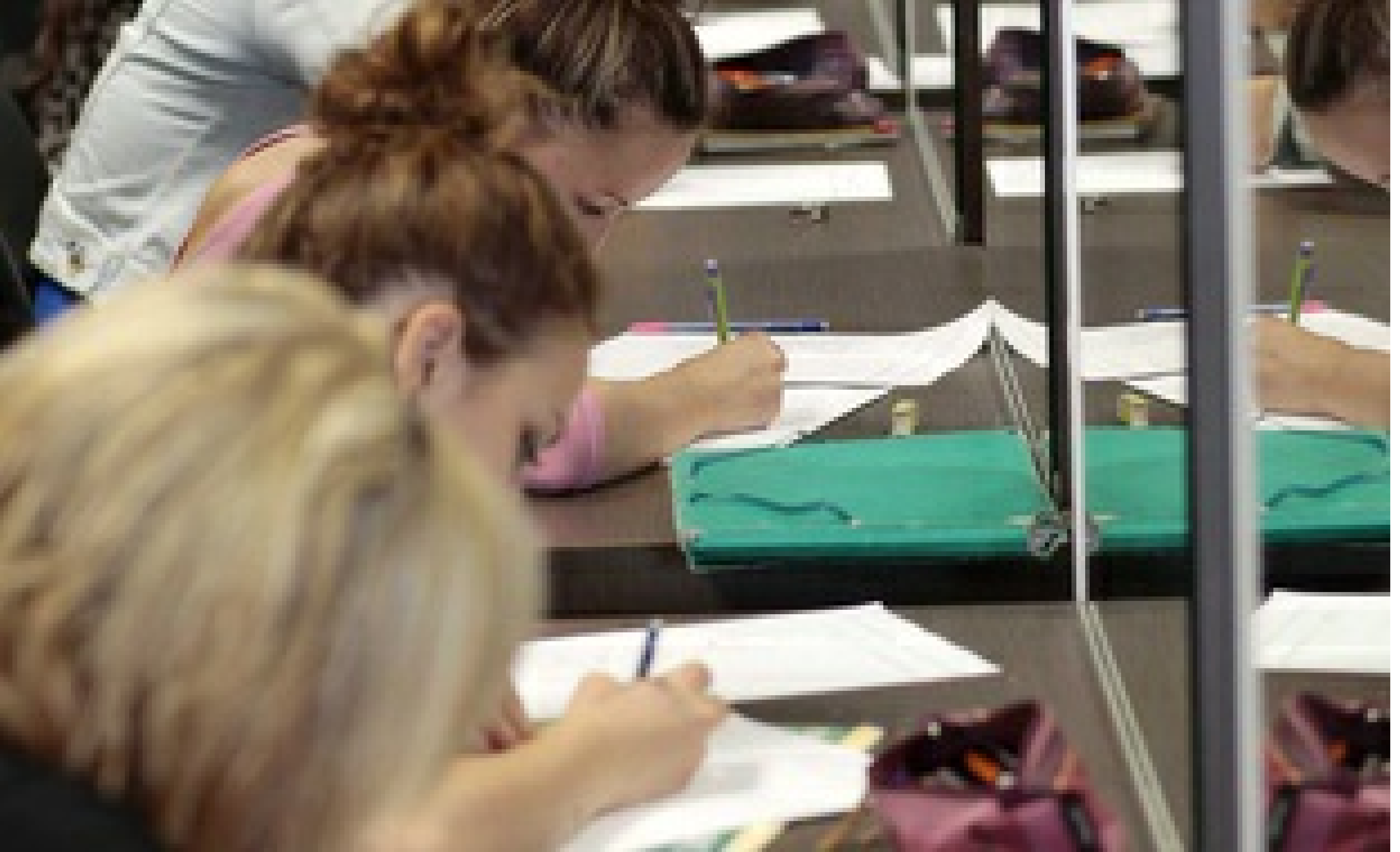
Etudiants passant un examen. Image d'illustration

Naomi Mackako | Publié le 13/02/18 à 13h01 — Mis à jour le 13/02/18 à 13h01