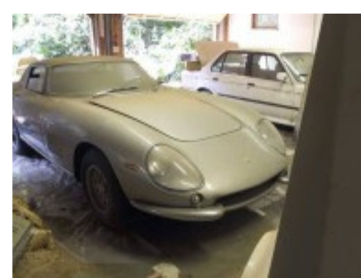
Sortie de grange : une Ferrari 275 GTB et une Shelby Cobra retrouvées-8973395.html)

Réservez gratuitement un essai automobile dans une concession proche de chez vous