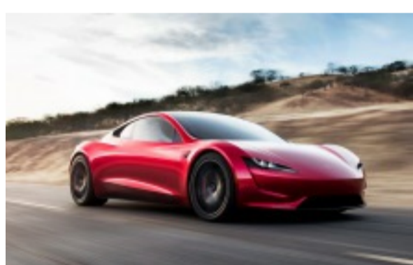
(images/images/txt_2018-tesla-Le nouveau Roadster de Tesla devrait sortir en 2020.

Sergio Marchionne a également indiqué que Ferrari serait le premier constructeur de luxe à construire une supercar électrique. Avec la volonté de venir concurrencer Tesla sur le marché des VE à hautes performances.