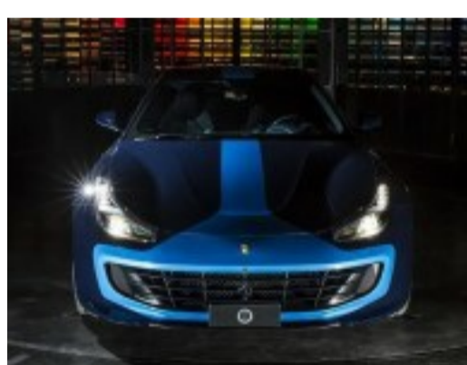
Ferrari GTCLusso (/actualite-automobile/ferrari-Azzurra : un gtc4lusso-azzurra-modèle un-mo-unique-unique par par-garage-italia-Garage Italia 8982401.html)