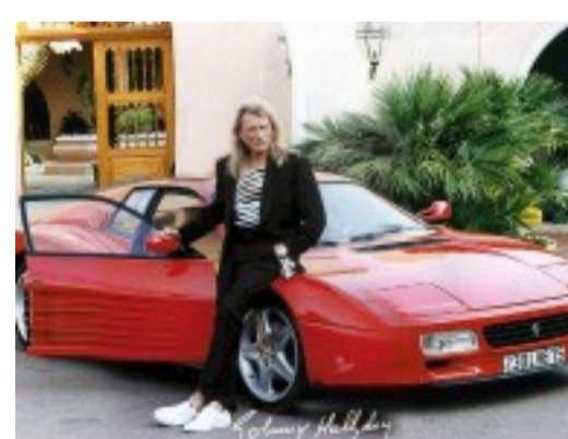
La Ferrari 512 TR de Johnny Hallyday en vente-8978401.html