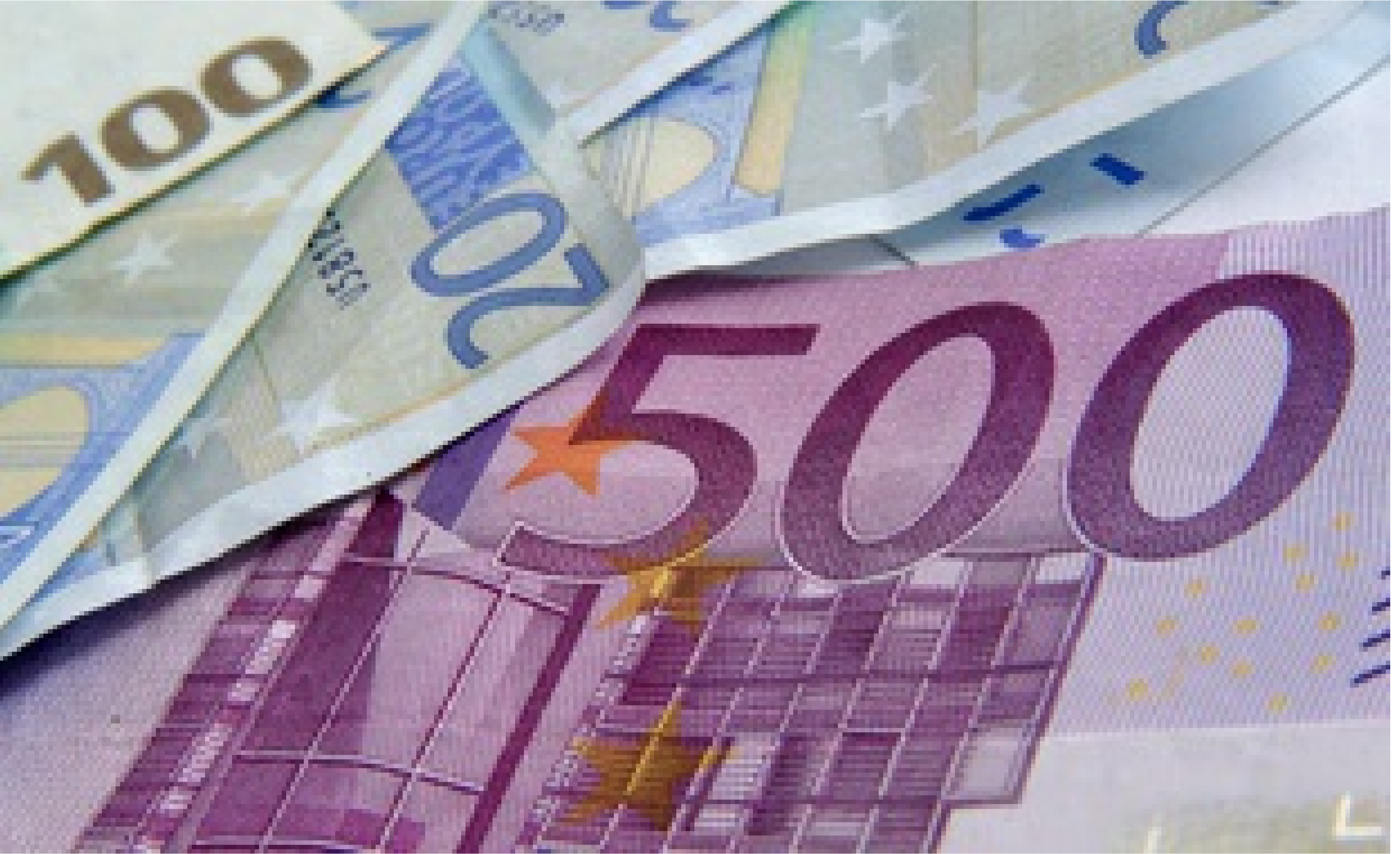
Billets de banque (illustration)

20 Minutes avec agence | Publié le 13/02/18 à 12h39 — Mis à jour le 13/02/18 à 12h39