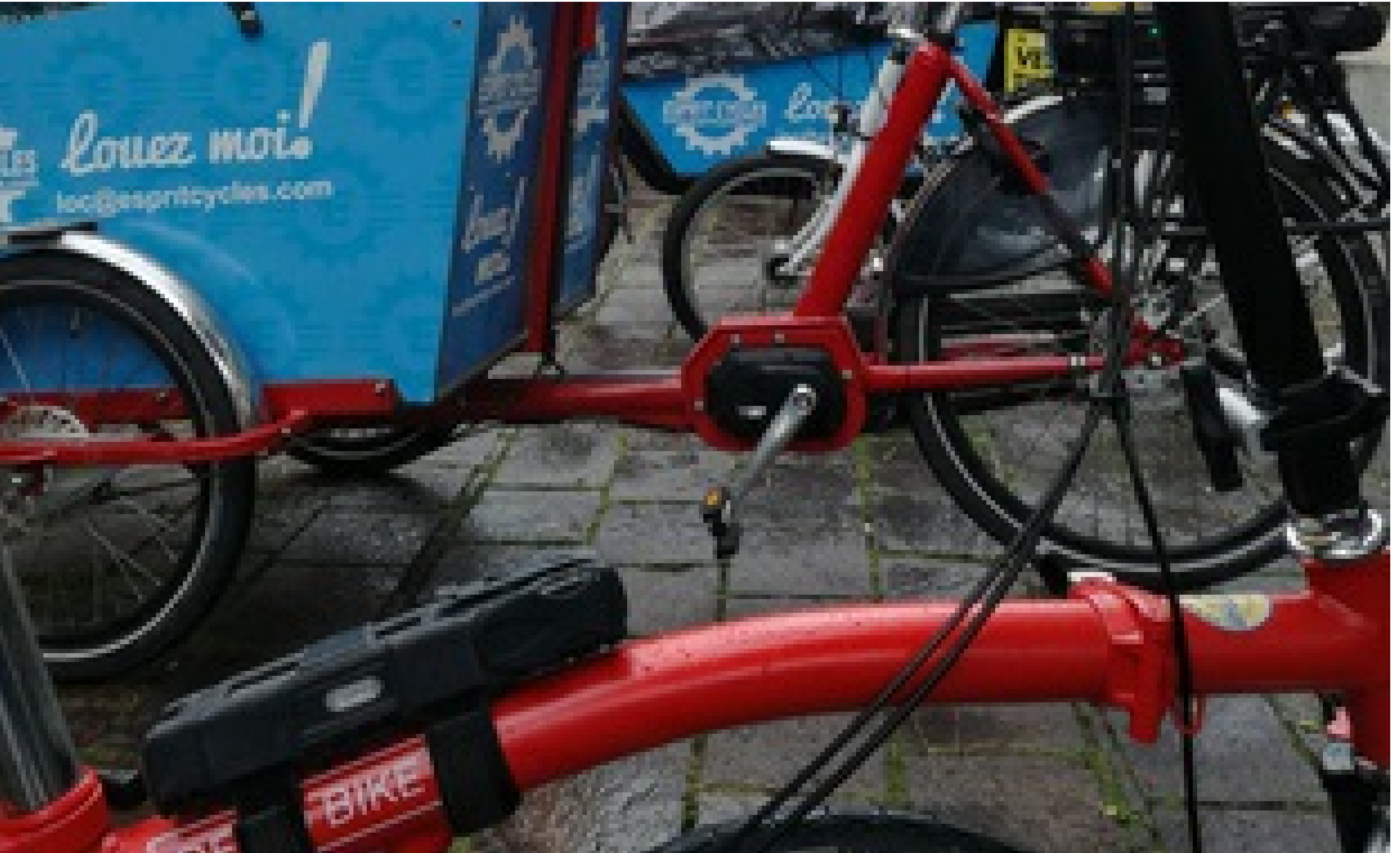
Une journée d'essais ouverte aux Strasbourgeois avait été organisée afin de choisir les futurs équipements de Velhop en septembre 2017.

Bruno Poussard | Publié le 13/02/18 à 12h55 — Mis à jour le 13/02/18 à 12h55