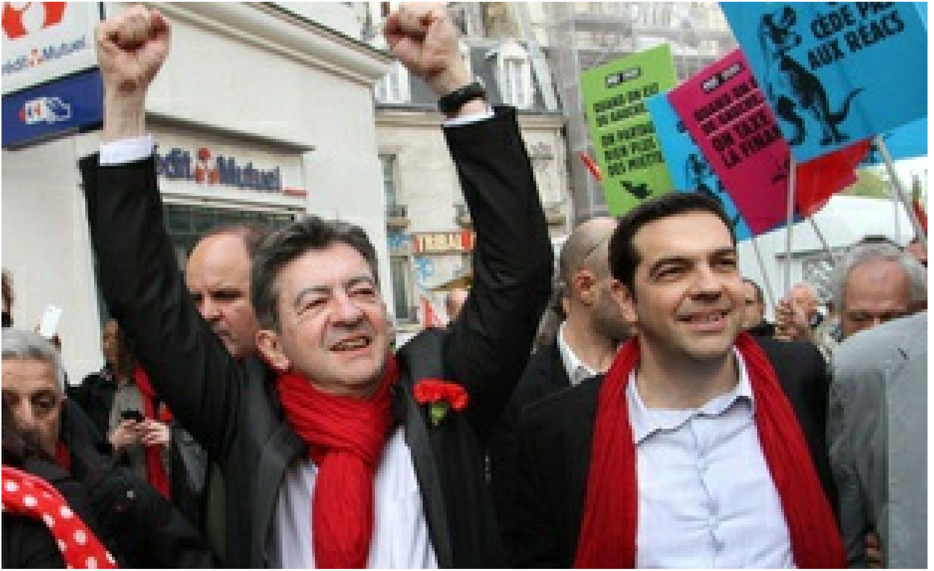
Jean-Luc Mélenchon et Alexis Tsipras à Paris, en avril 2014.