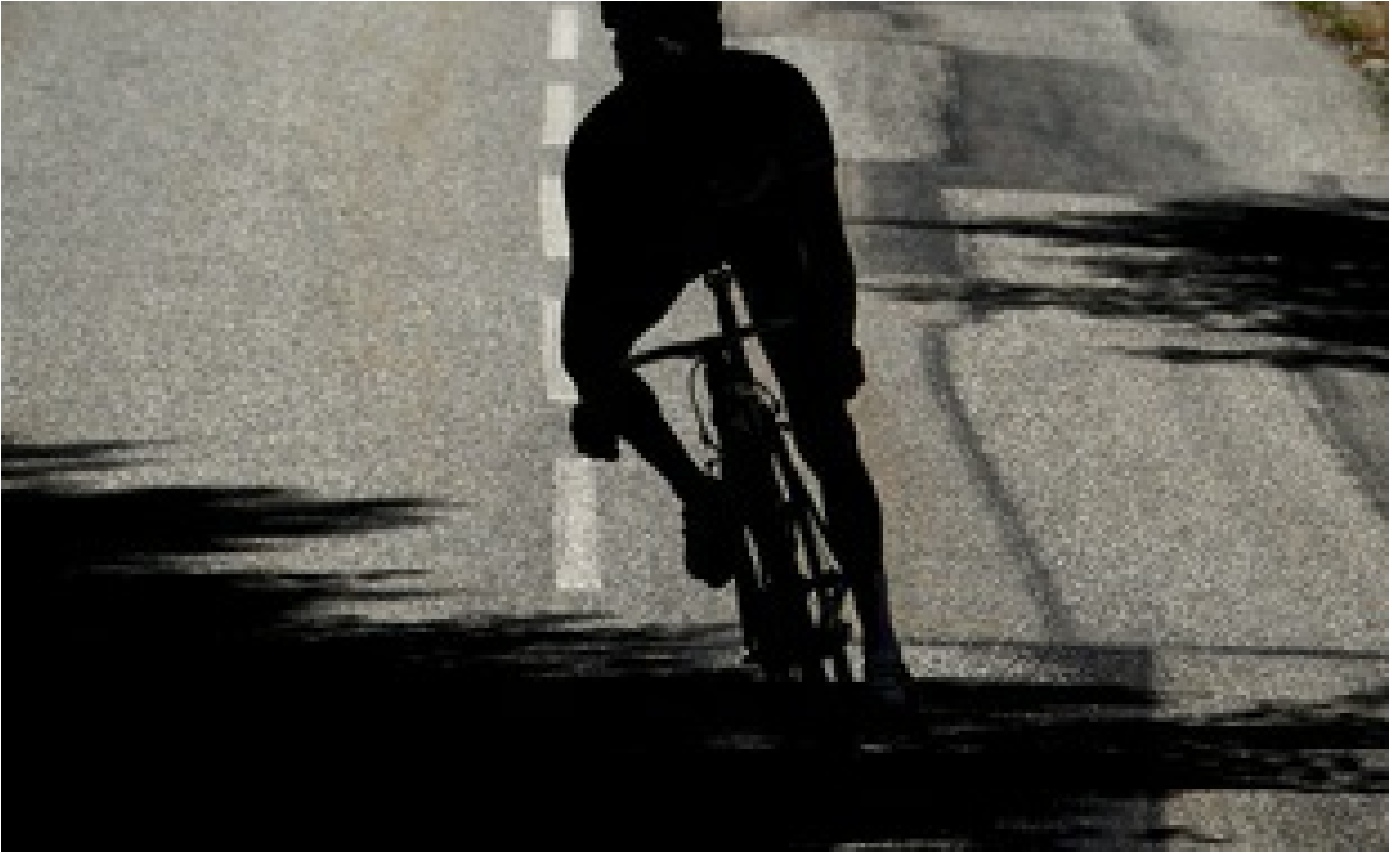
Un coureur cycliste. Illustration.

B.C. | 🕒 Publié le 18/04/18 à 19h54 — Mis à jour le 18/04/18 à 20h48