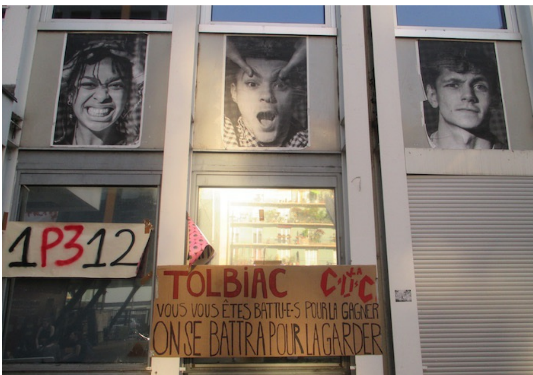
A l'université Paris III, dite Censier.

Tout au long de la journée de samedi, nous actualisons l'article en continu, pour intégrer les vérifications que nous faisons et les démentis officiels. Tous vont dans le même sens : les faits allégués par les témoins ne sont pas confirmés.