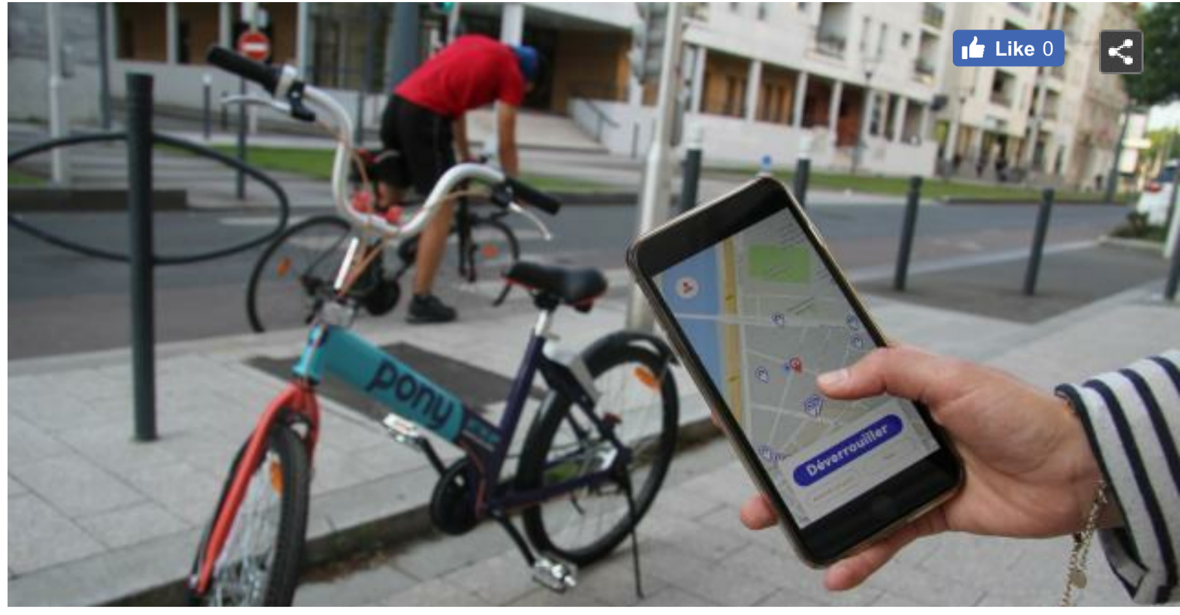
Pony Bikes, la société de vélos en libre-service, va faire face à un nouveau concurrent à partir de jeudi 17 mai.

Dès jeudi 17 mai, un opérateur privé de vélos en libre-service payant débarquera à Angers. L'entreprise Indigo weel va concurrencer Pony Bikes, implanté depuis octobre 2017. La course est lancée.