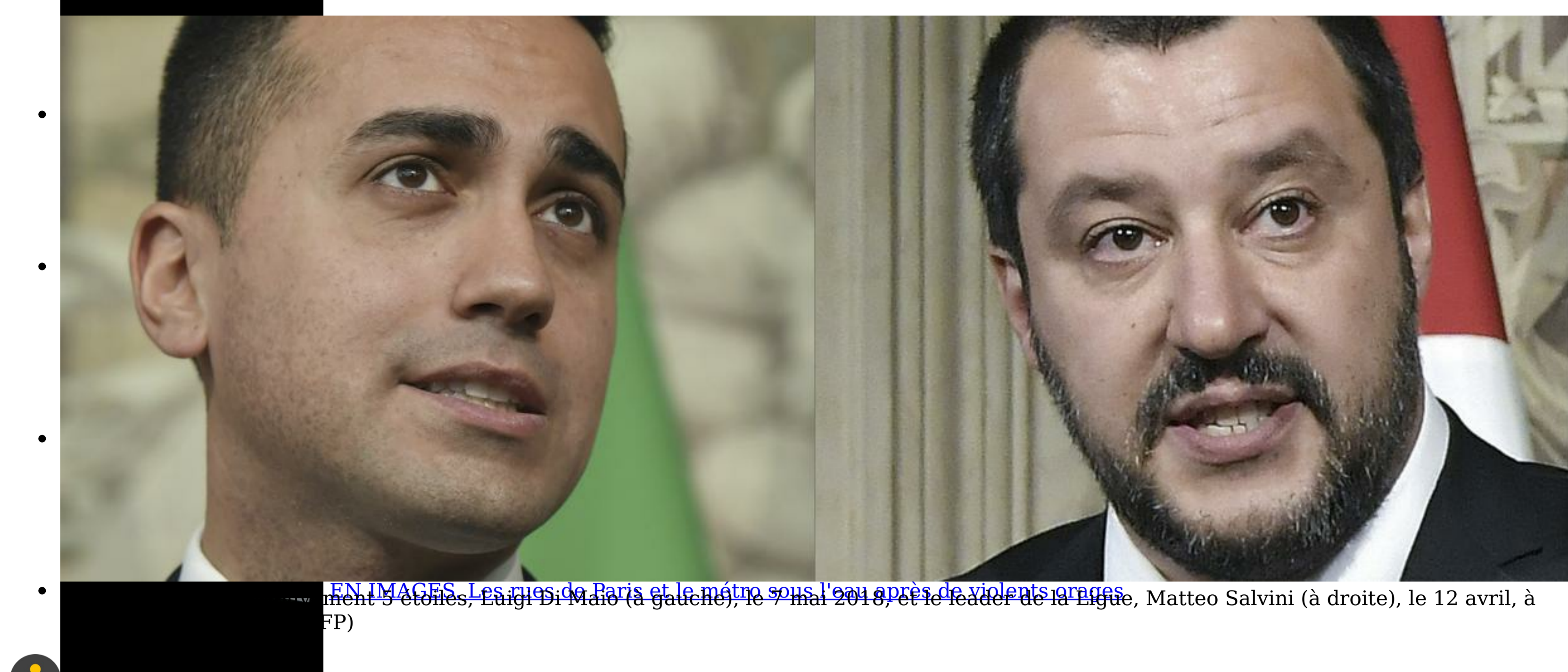
EN IMAGES. Les axes de Di Maio et le maître sous l'eau après de violents orages. Matteo Salvini (à droite), le 12 avril, à Rome.

Coupe du monde : vexé de ne pas avoir été retenu avec les Bleus, le Parisien Adrien Rabiot refuse d'être réserviste rédigé entre les deux partis promet davantage de fermeté contre la corruption, la délinquance et l'immigration.