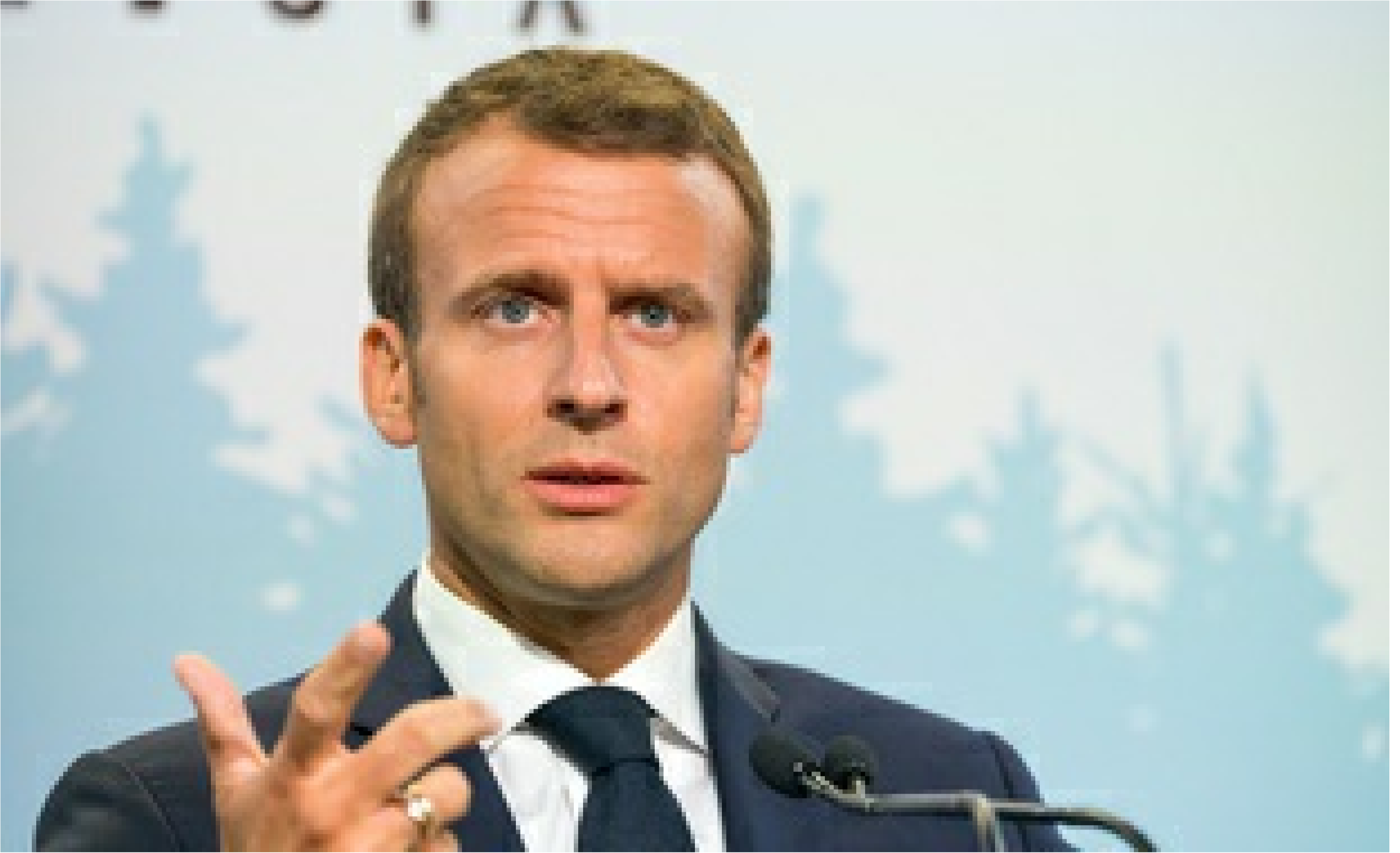
Emmanuel Macron au G7 au Canada, le 9 juin 2018. — "Un euro cotisé devra donner pour tous les mêmes droits. C'est la clé pour retrouver la justice et la confiance dans le système. Une loi [de réforme des retraites] sera présentée au début de l'année 2019 et votée au premier semestre 2019. Ce ne sera pas une énième réforme budgétaire."

L.C. | Publié le 13/06/18 à 14h09 — Mis à jour le 13/06/18 à 14h09