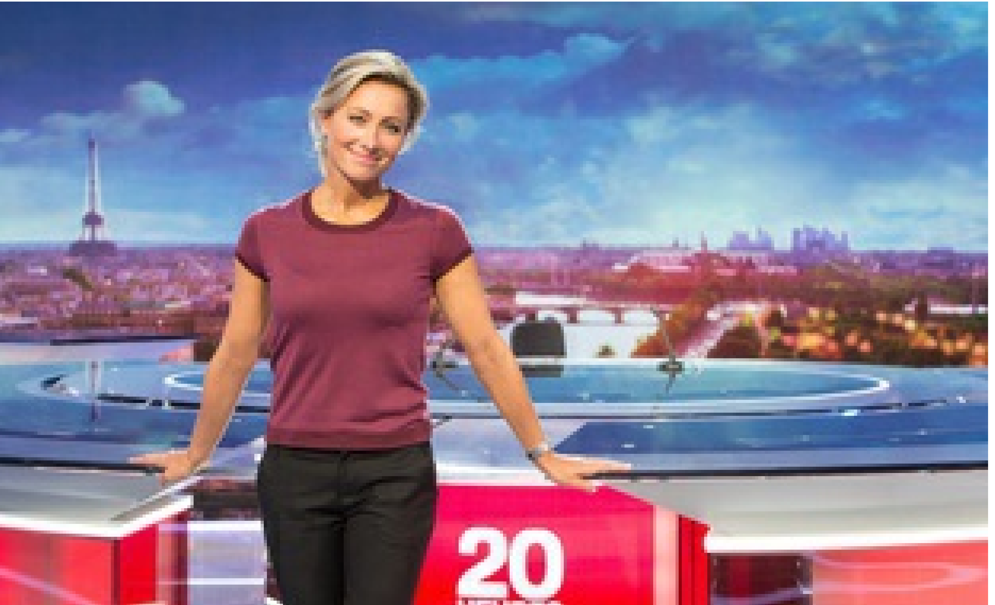
La journaliste Anne-Sophie Lapix.

F.R. | Publié le 14/06/18 à 12h51 — Mis à jour le 14/06/18 à 13h13