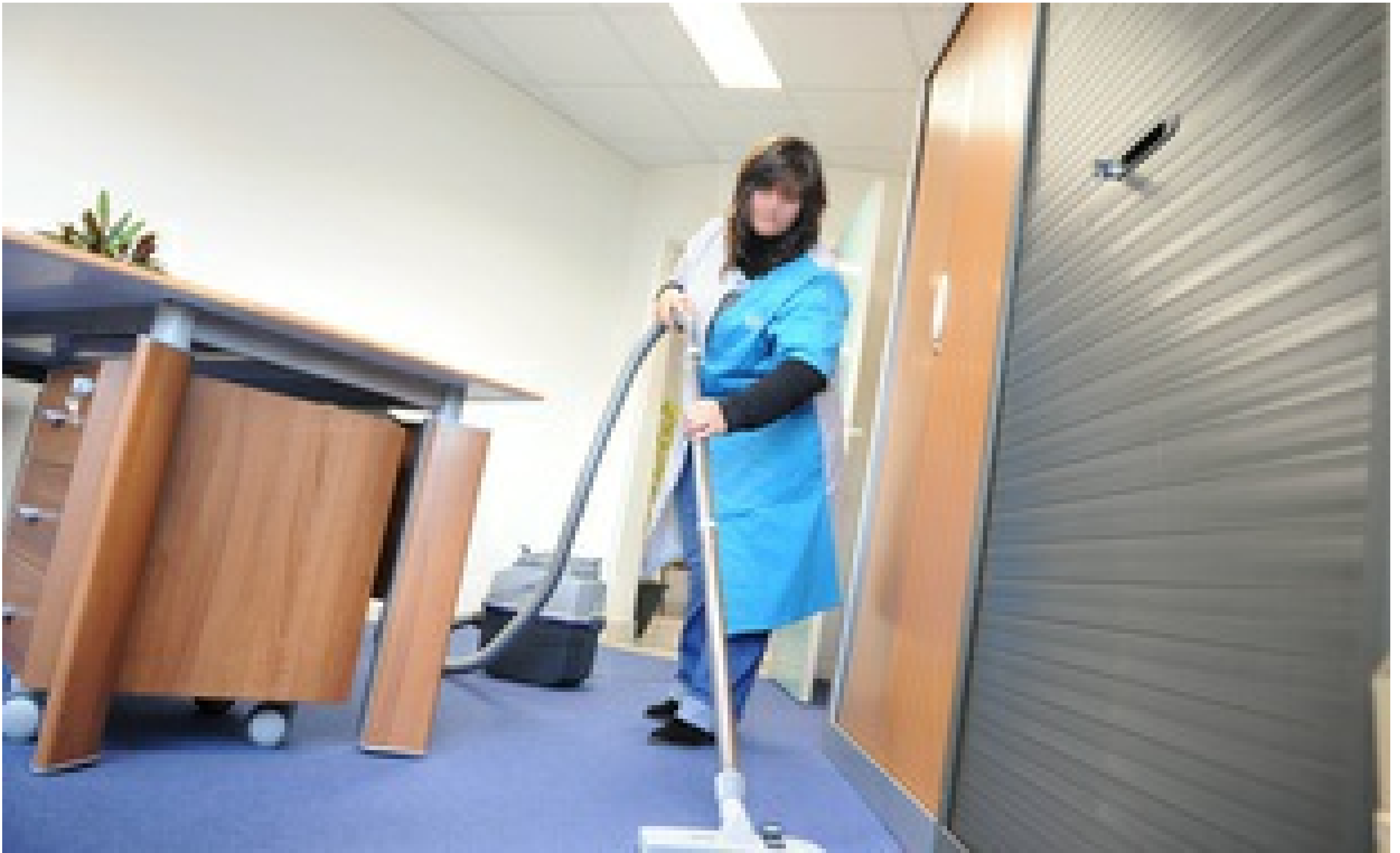
Une employée de ménage dans un bureau (illustration).

20 Minutes avec agence | Publié le 11/07/18 à 14h12 — Mis à jour le 11/07/18 à 14h12