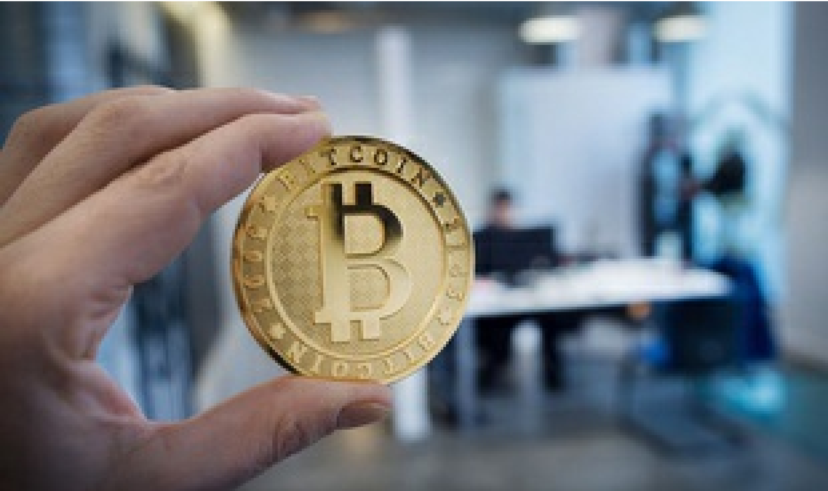
Illustration d'un bitcoin.