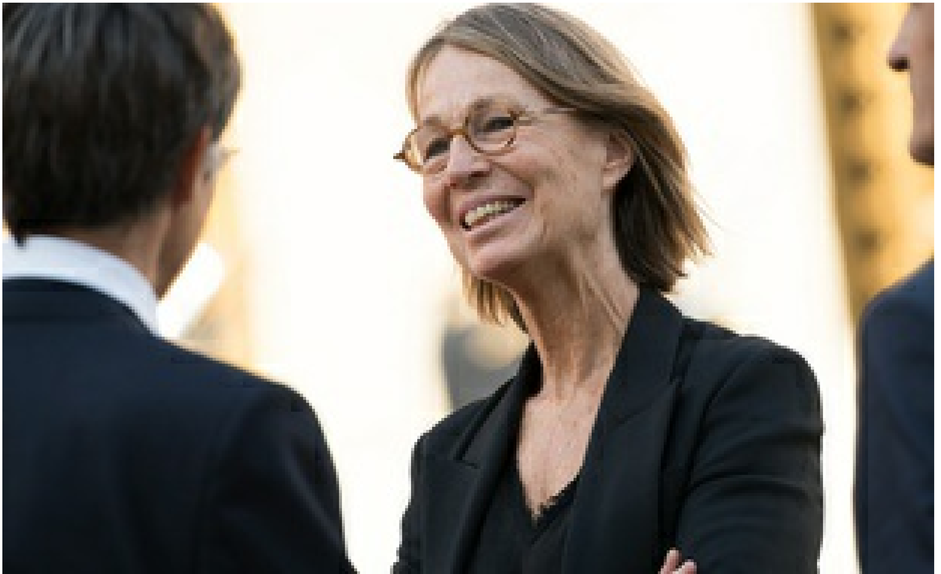
La ministre de la Culture Françoise Nyssen.

20 Minutes avec AFP | 🕒 Publié le 14/09/18 à 15h42 — Mis à jour le 14/09/18 à 15h42