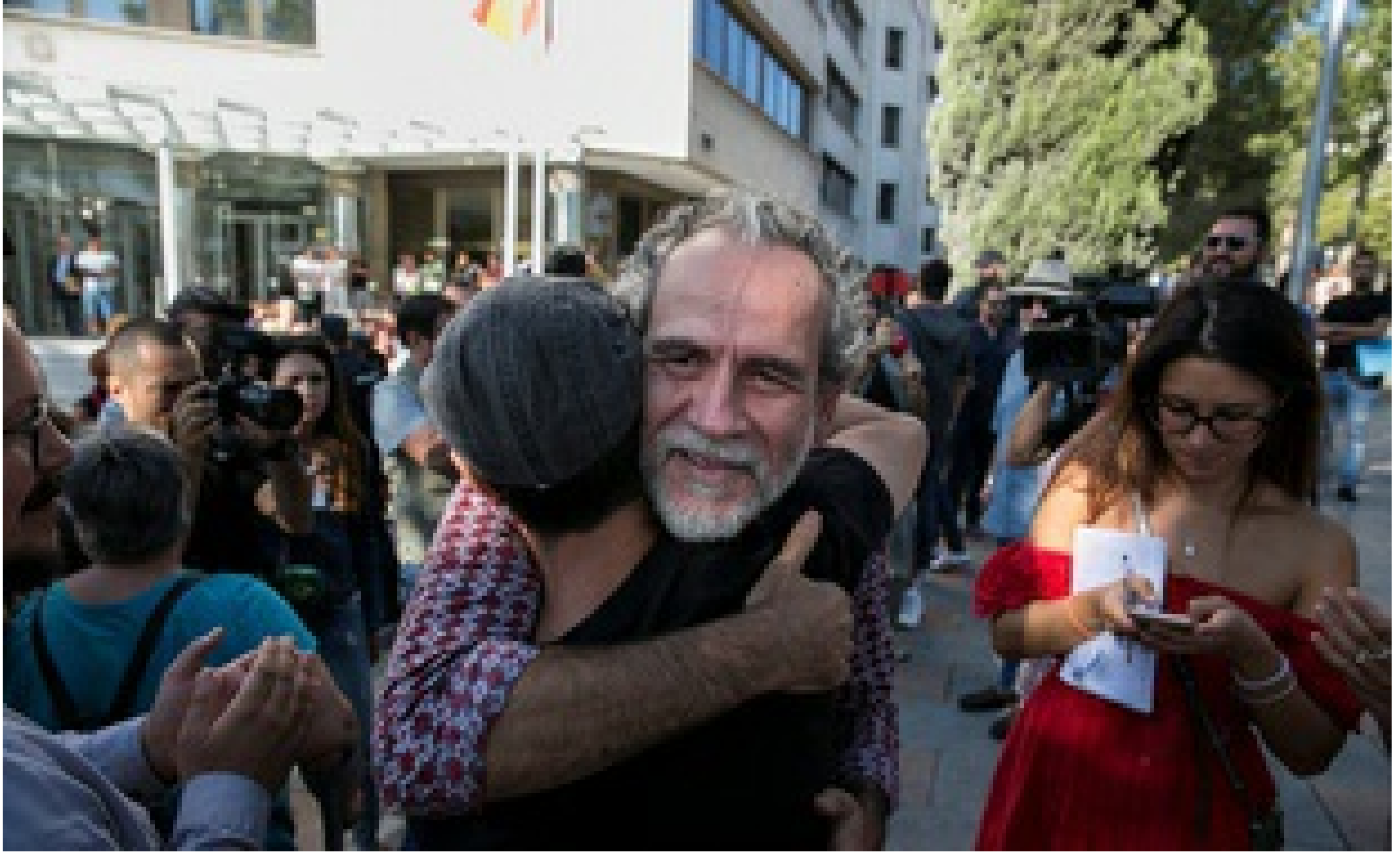
L'acteur espagnol Willy Toledo, poursuivi pour blasphème, a été remis en liberté conditionnelle ce jeudi 13 septembre.

20 Minutes avec agences | Publié le 14/09/18 à 14h22 — Mis à jour le 14/09/18 à 14h22