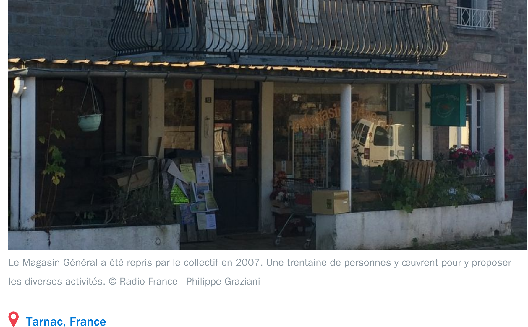
Le Magasin Général a été repris par le collectif en 2007. Une trentaine de personnes y œuvrent pour y proposer les diverses activités.

Le collectif qui gère le "Magasin Général", l'épicerie-bar du village de Tarnac, veut acquérir le bâtiment. Il a lancé une campagne de financement participatif. Une nouvelle étape dans l'aventure lancée en 2007 par une trentaine d'amis, marquée notamment par l'affaire Tarnac.