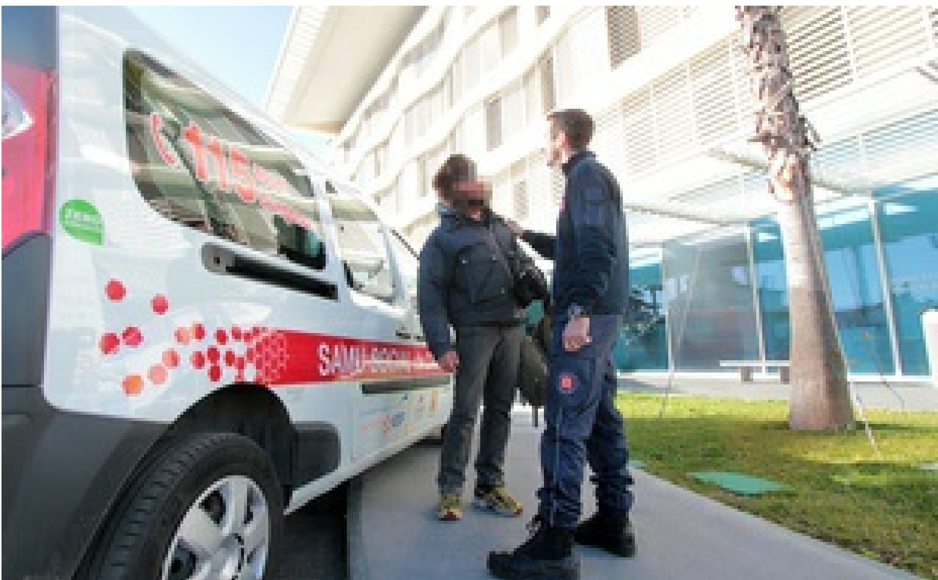
Le Samu social de Cannes (Illustration)

Fabien Binacchi | Publié le 07/11/18 à 15h47 — Mis à jour le 07/11/18 à 15h47