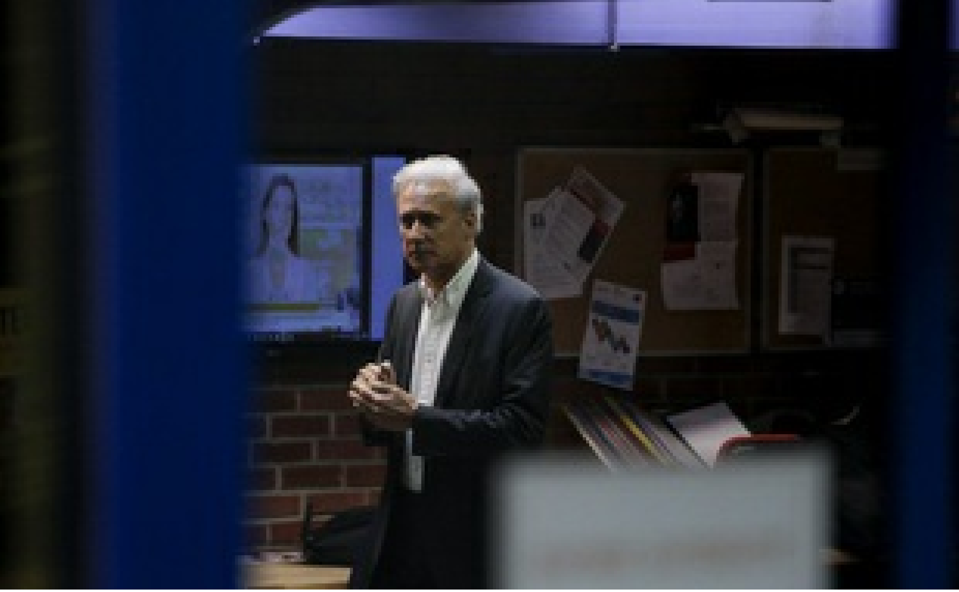
Georges Tron est jugé à Bobigny pour