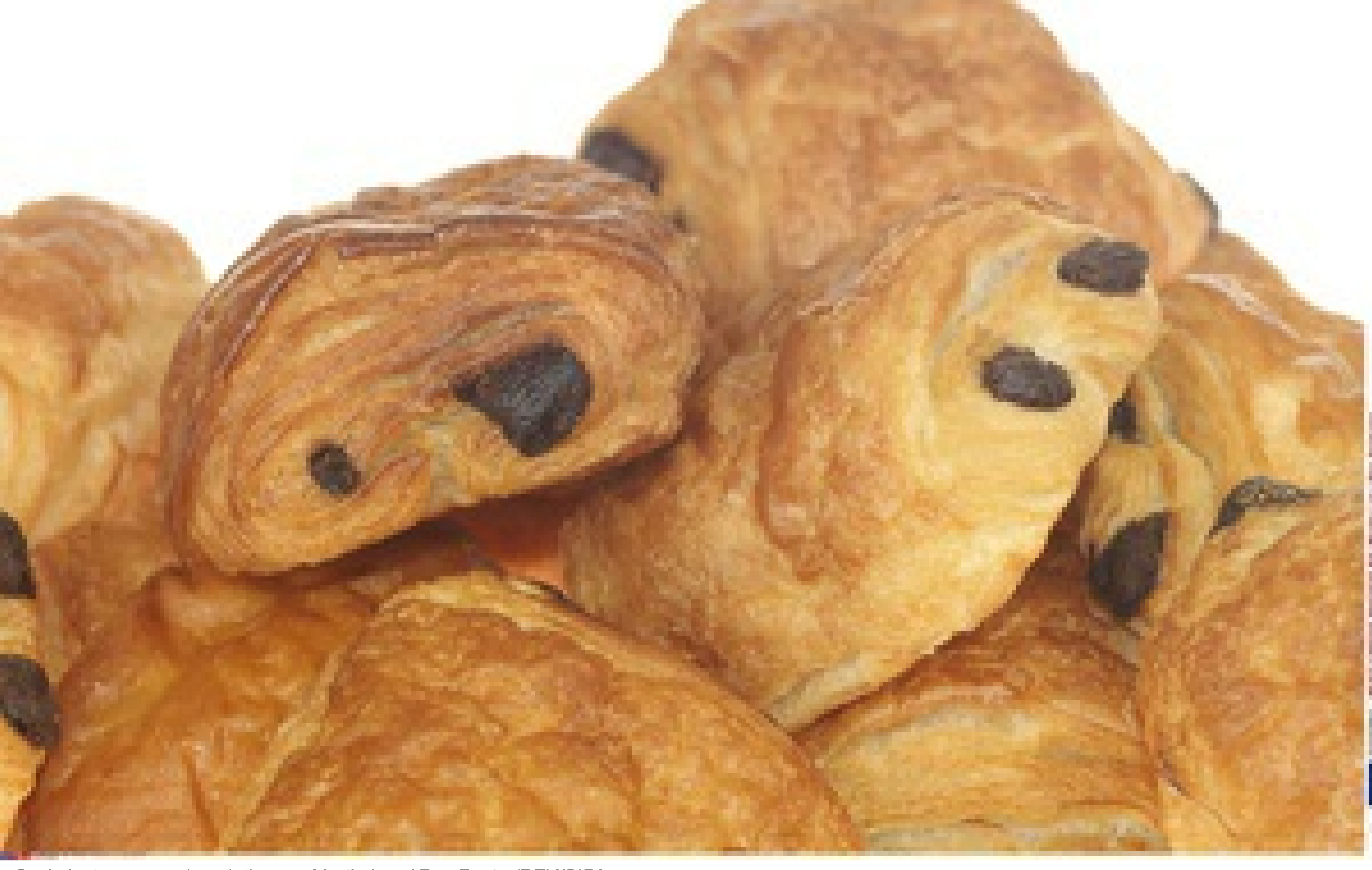
Ceci n'est pas une chocolatine.

Helene Menal | Publié le 14/11/18 à 13h30 — Mis à jour le 14/11/18 à 13h30