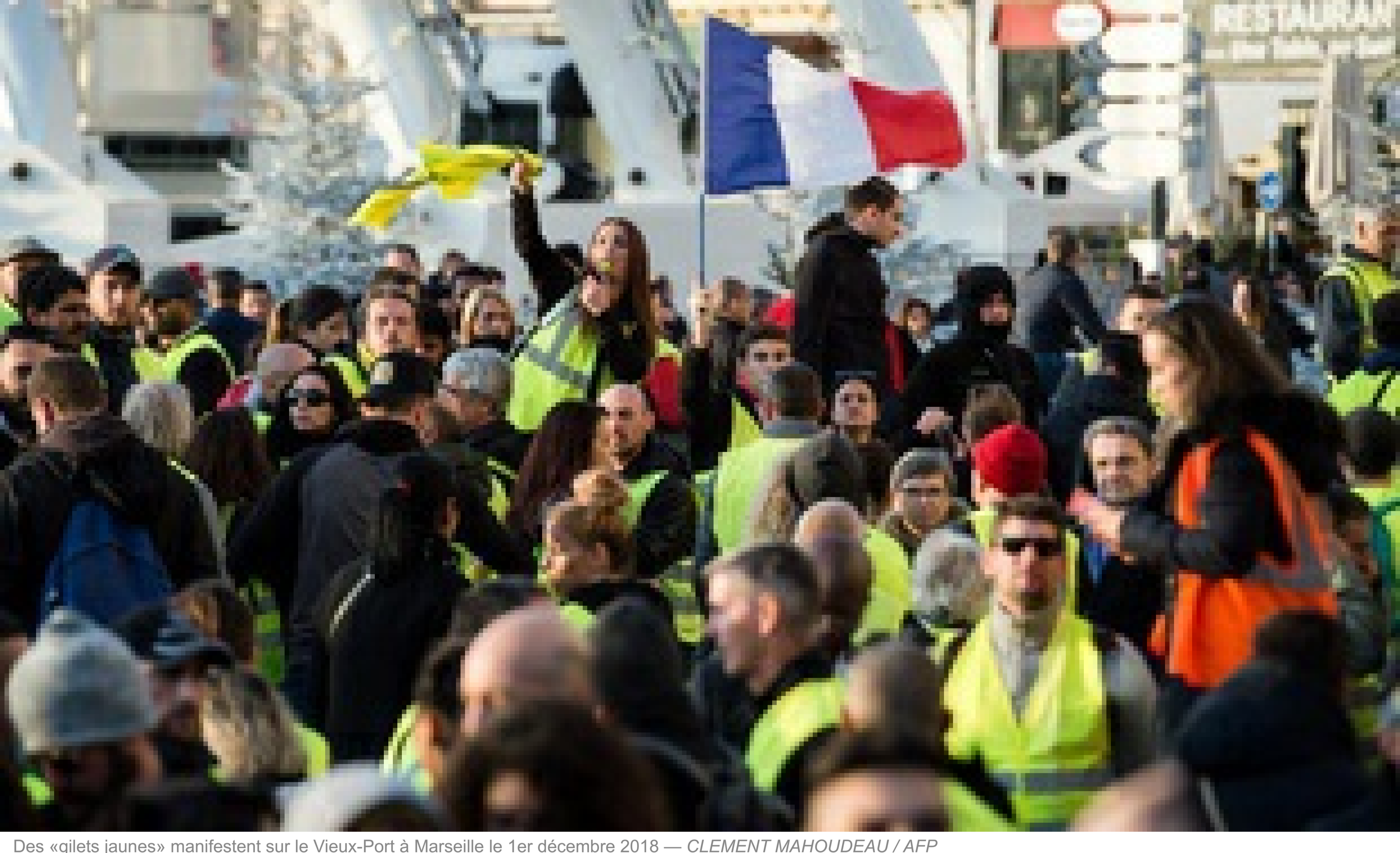
Des «gilets jaunes» manifestent sur le Vieux-Port à Marseille le 1er décembre 2018