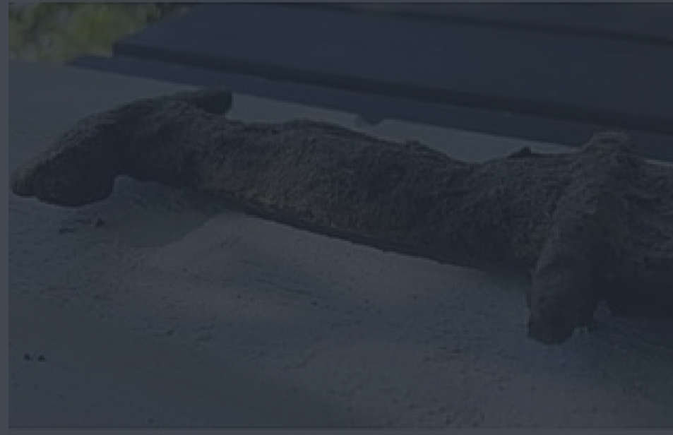
Le Dauphiné Libre s, elle fait une incroyable verte... au fond d'un lac

Publié le 06/12/2018 à 18:46 | Vu 8657 fois