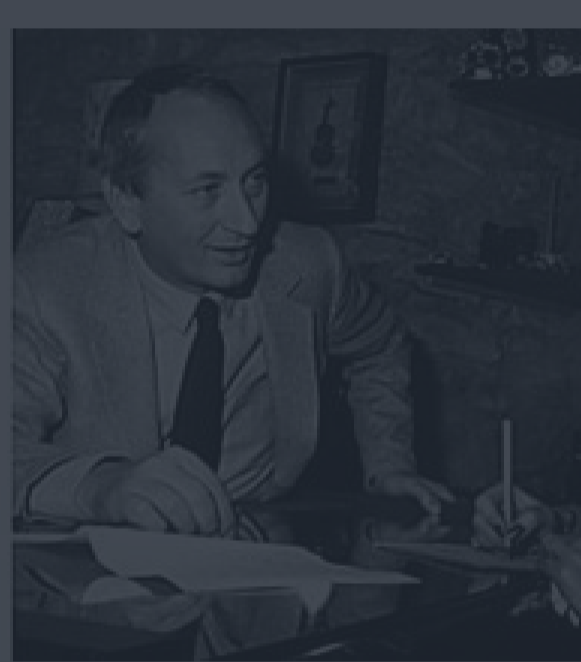
Joseph Joffo, auteur d' 'Un sac de billes' : les liens forts avec nos parents

CONNECTEZ-VOUS POUR LAISSER UN COMMENTAIRE