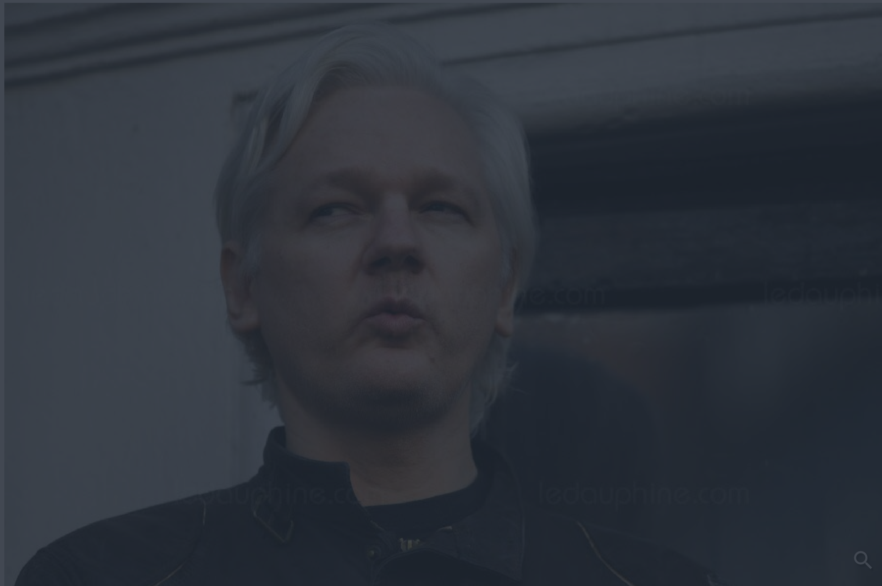
Julian Assange, fondateur de Wikileaks.