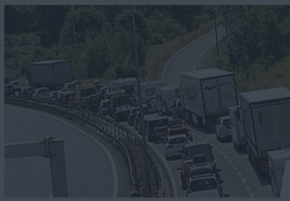
Un couple poursuivi pour un rapport sur l'autoroute

Publié le 11/12/2018 à 14:20 | Vu 12045 fois