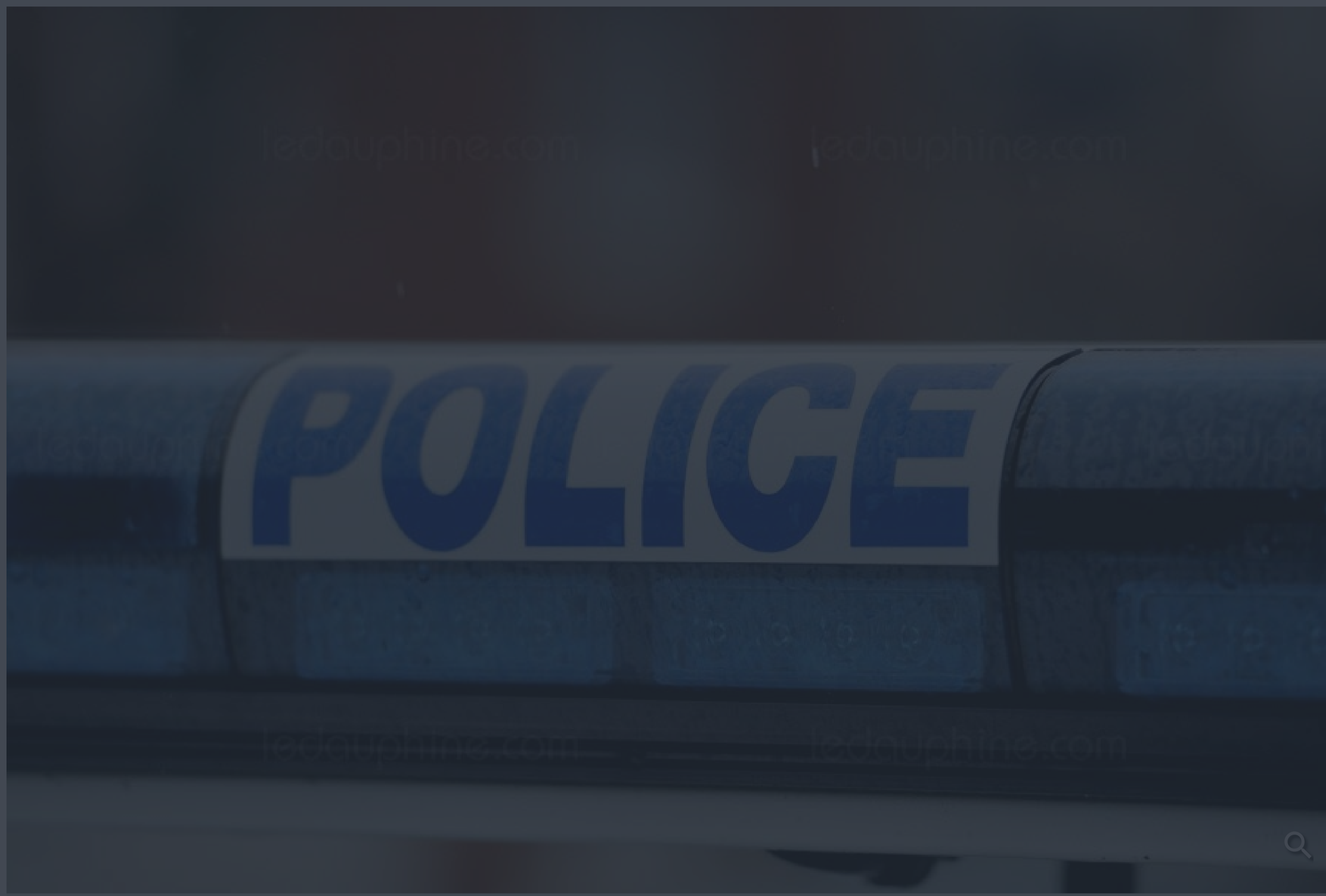
L'adolescente a été retrouvée prostrée et partiellement dénudée dans la rue.