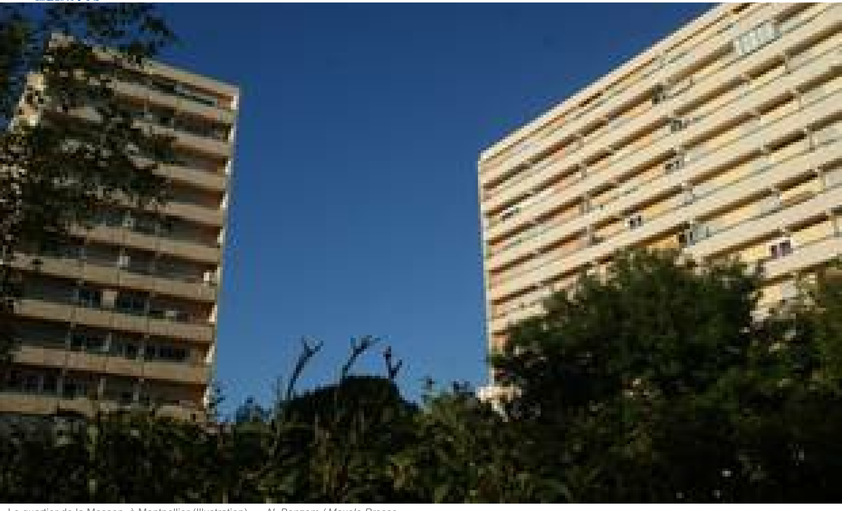
Le quartier de la Mosson, à Montpellier (Illustration).