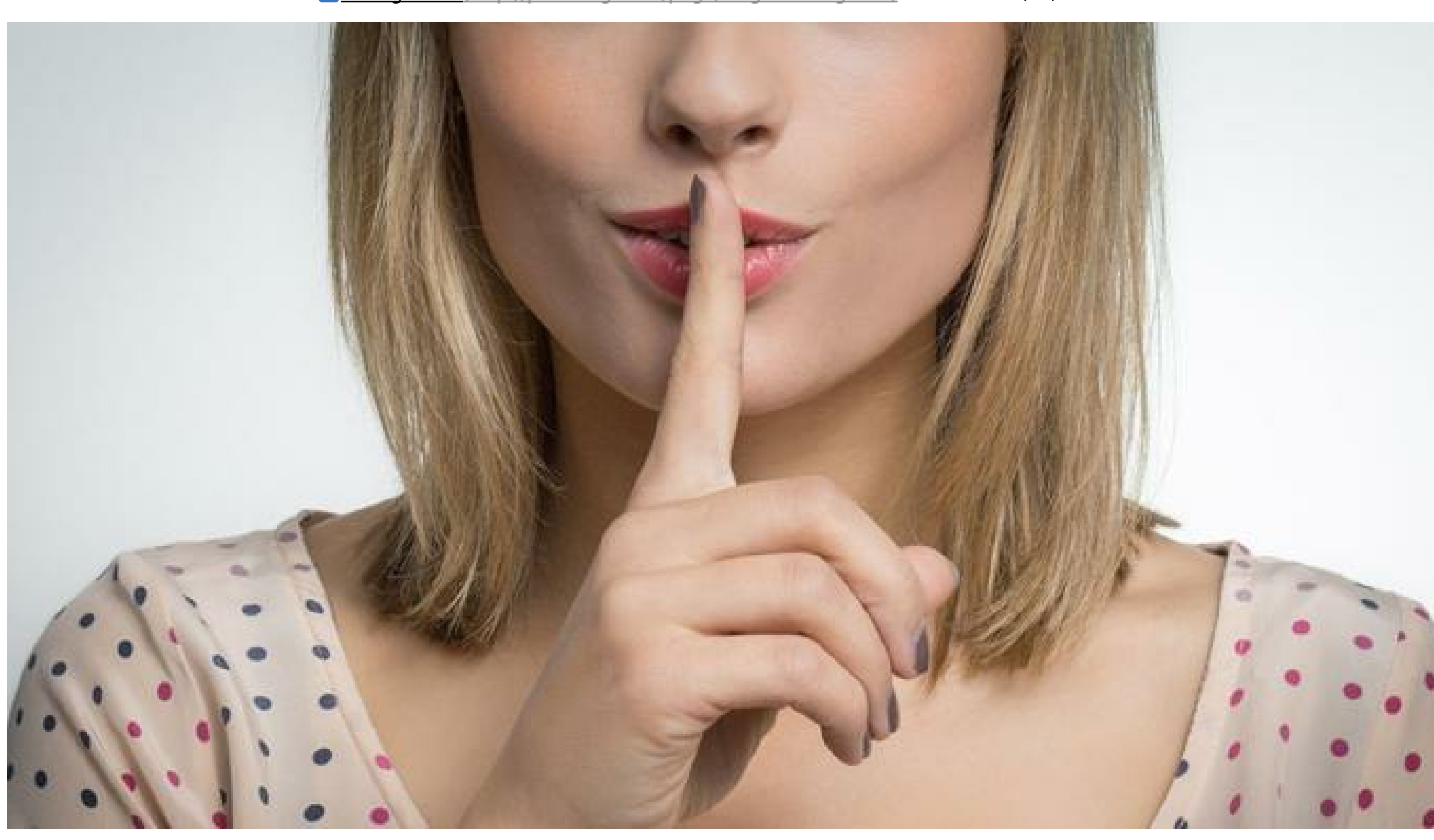
Saviez-vous qu'«aller aux petites bottines» désigne le fait de «rendre visite à l'abbaye des dames», un endroit où les femmes recevaient leurs clients?

Par Le figaro.fr | Publié le 09/02/2019 à 07:00