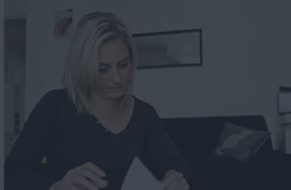
Une enseignante harcelée durant neuf ans : le directeur a été écroué