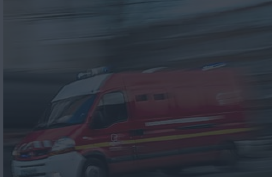
Le directeur d'un car scolaire meurt 3 collégiens à bord

Par D.M. | Publié le 09/02/2019 à 15:49 | Vu 35497 fois