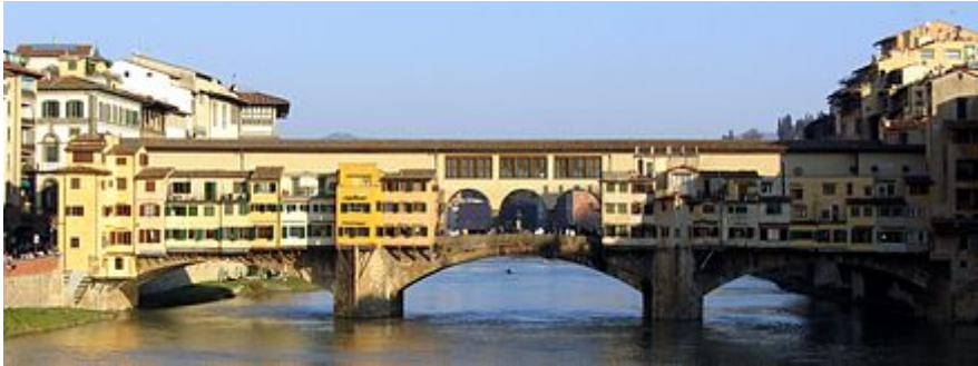
Ponte Vecchio, à Florence

Le Ponte Vecchio , à Florence , fut construit en 1345 pour remplacer l' antique pont romain sur l' Arno . En 1564 , Giorgio Vasari restructura le pont sur l'ordre du Grand Duc Ferdinand I er pour y faire passer le corridor de Vasari ( Corridoio Vasariano ) reliant le Palazzo Vecchio au Palais Pitti . Les boutiques furent alors réservées aux seuls joailliers et orfèvres .