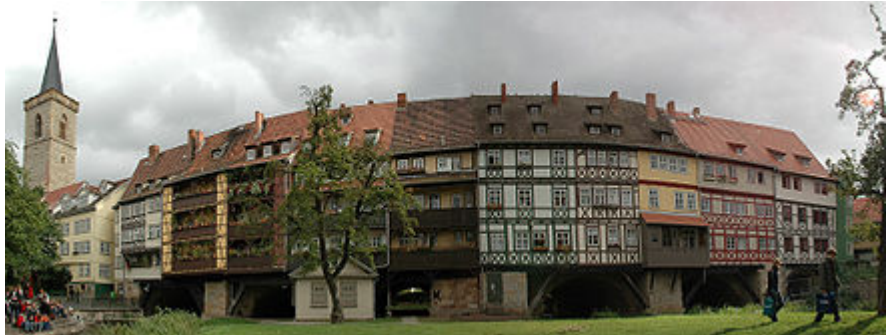
Pont des Épiciers, Erfurt