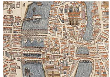
Ponts de l'île de la Cité au xvi e siècle.