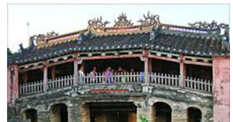
Pont-pagode japonais de Hôi An

Un exemple de pont bâti préservé est le pont-pagode japonais de Hôi An , au Viêt Nam , qui contient un temple bouddhiste et qui fut jadis utilisé comme palais de justice .