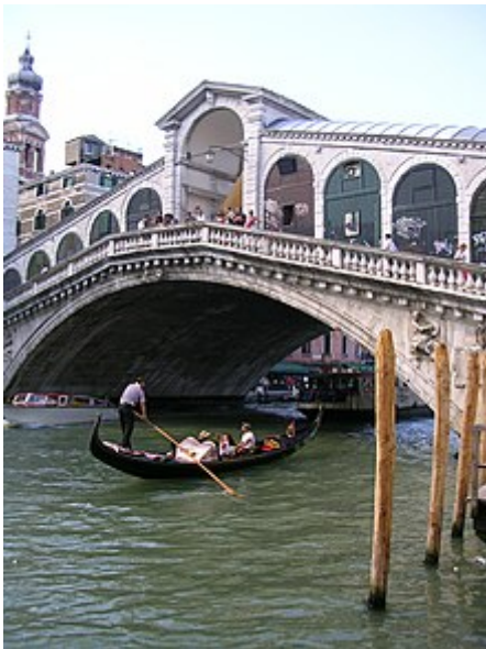
Pont du Rialto, à Venise

Le pont du Rialto est le plus célèbre des quatre ponts sur le Grand Canal de Venise . Le pont tel qu'il existe aujourd'hui a été bâti entre 1588 et 1591 . Il relie les quartiers de San Marco et du Rialto , et il est surmonté de boutiques.