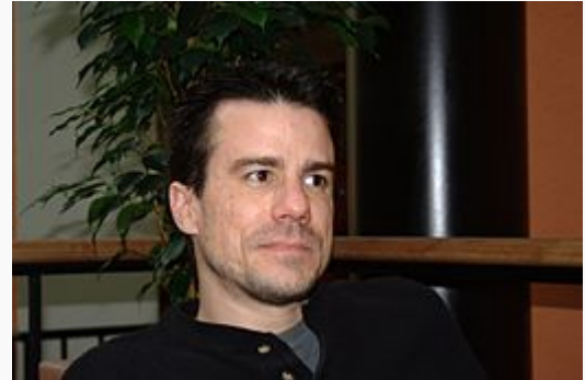
Ian Murdock en 2008