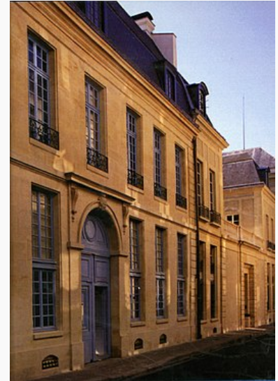
Façade de l' Hôtel de Mongelas