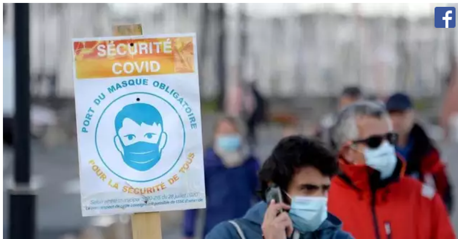
Le port du masque obligatoire en extérieur en Maine-et-Loire a été suspendu, ce jeudi 20 janvier 2022.