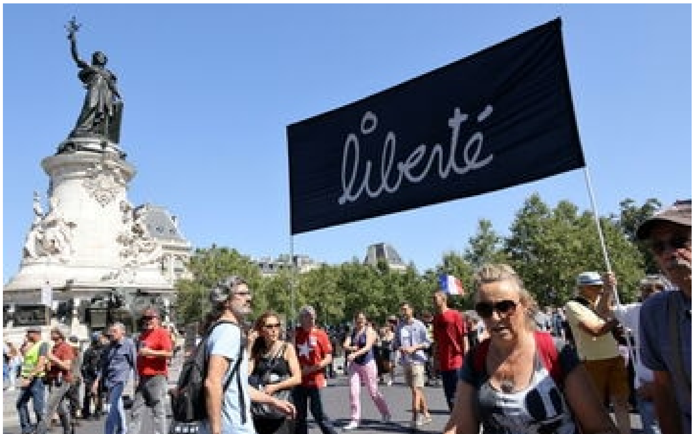
Abonnés Paris : place de la République, les manifestations à la chaîne exaspèrent les riverains