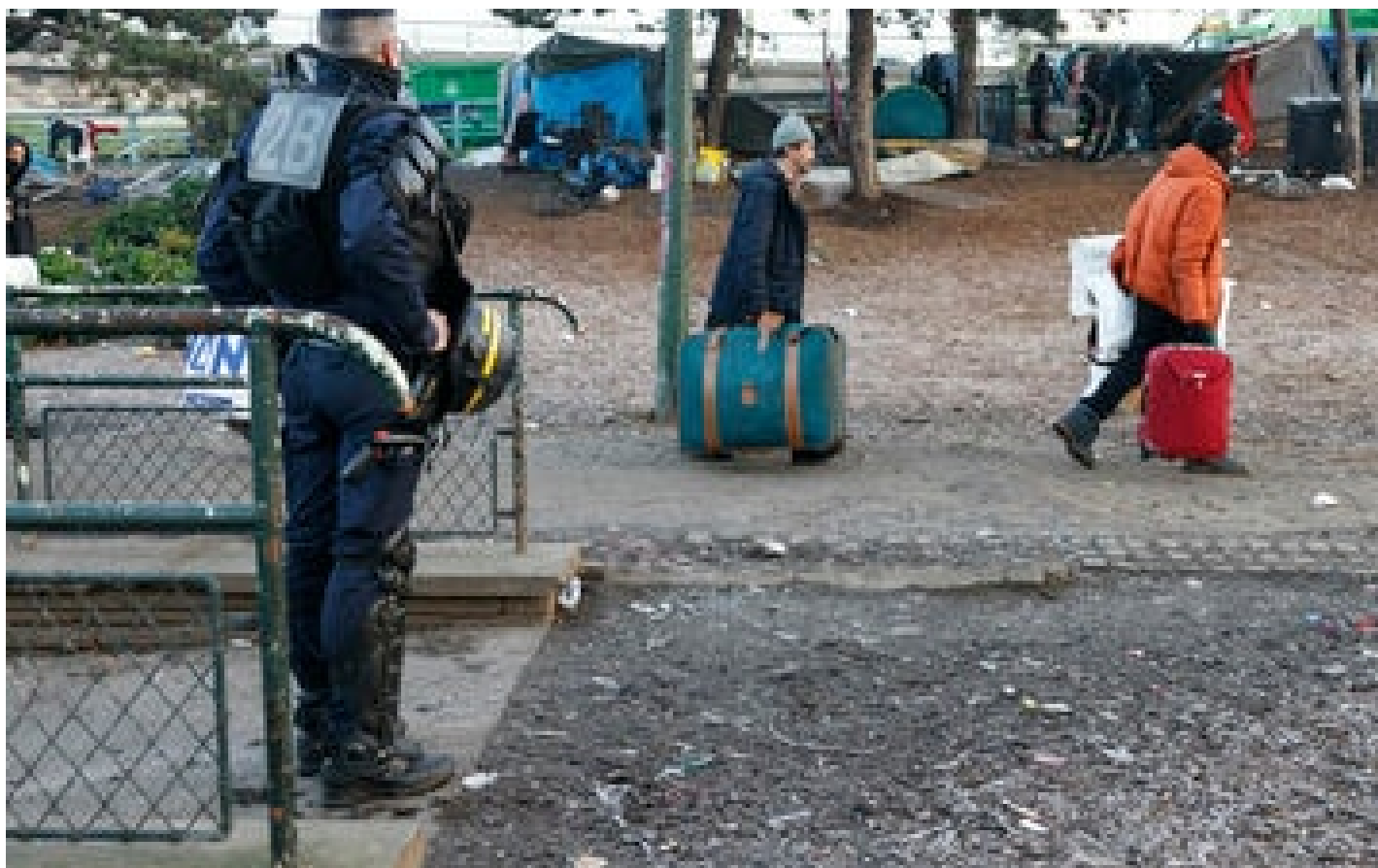
Crack à Paris : la préfecture de police renonce au déménagement des consommateurs à Bercy-Charenton