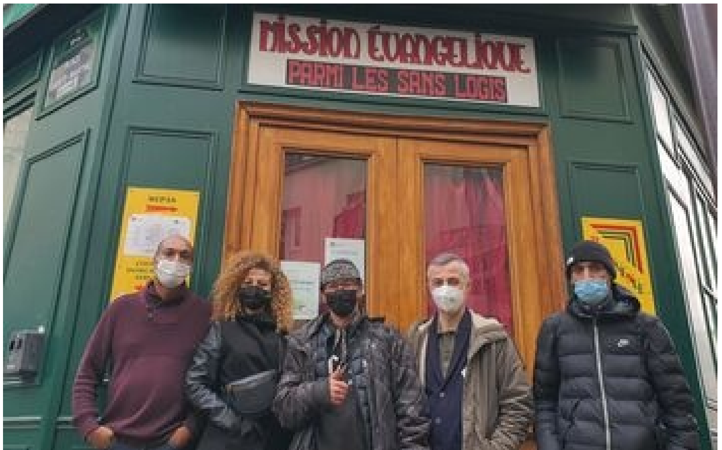
A Paris, des masques pour les sans-abri