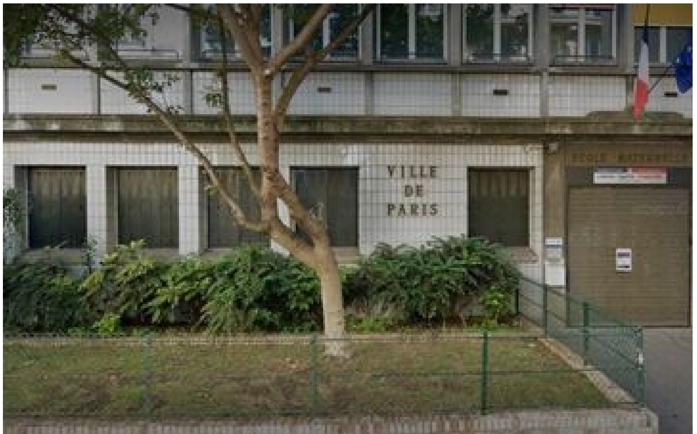
Abonnés Paris : avant la refonte de la carte scolaire, déjà la crainte de fermetures d'écoles