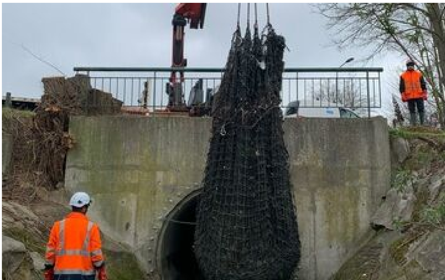
La Seine, décharge à ciel ouvert : des filets anti-déchets pour lutter contre la pollution à la source