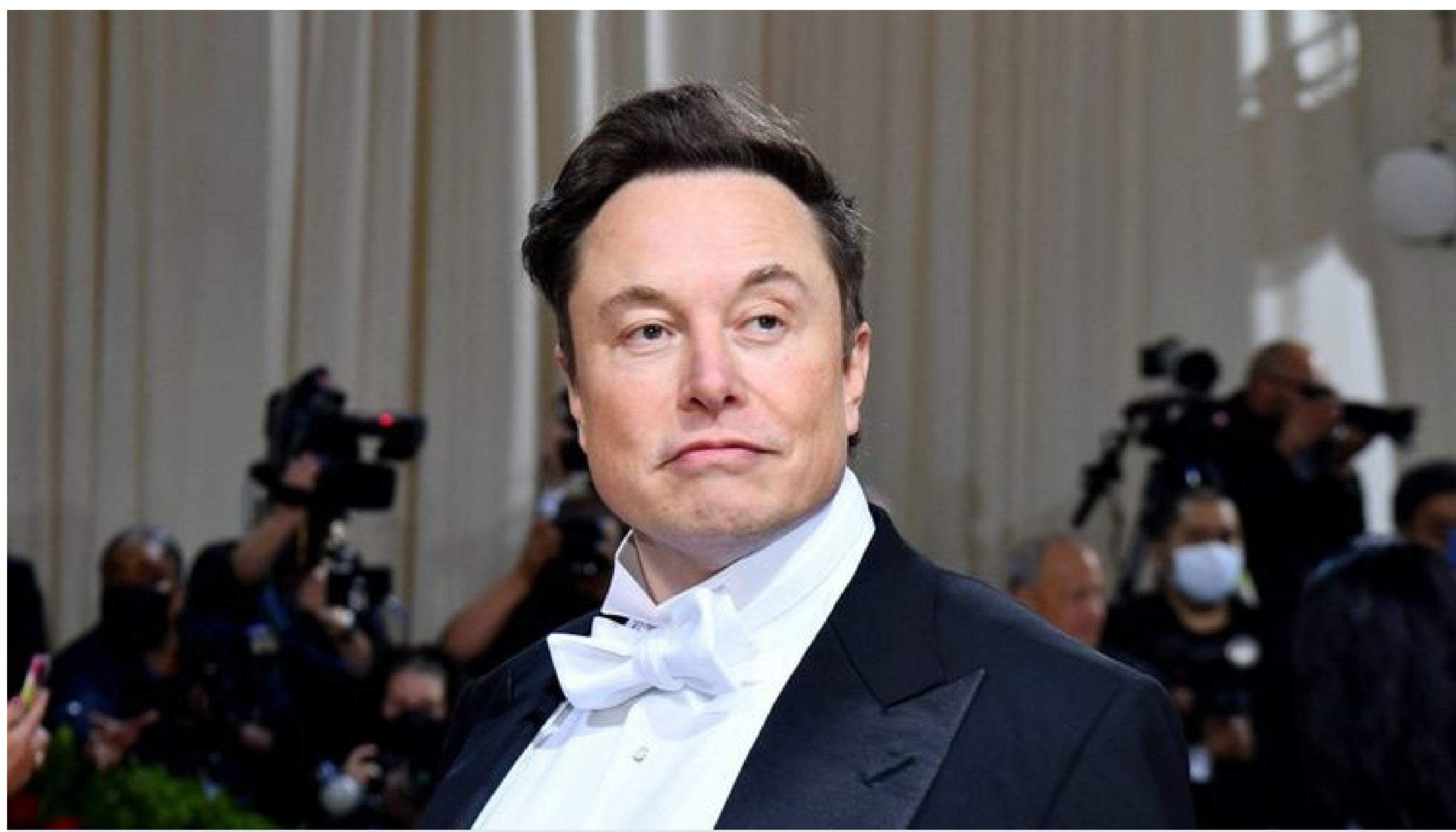
Le patron de Tesla, Elon Musk, le 2 mai 2022 à New York (Etats-Unis).

Le patron de Tesla et homme le plus riche de la planète, Elon Musk, a annoncé vendredi 13 mai suspendre le rachat de Twitter dans l'attente de détails sur la proportion de faux comptes sur le réseau social.