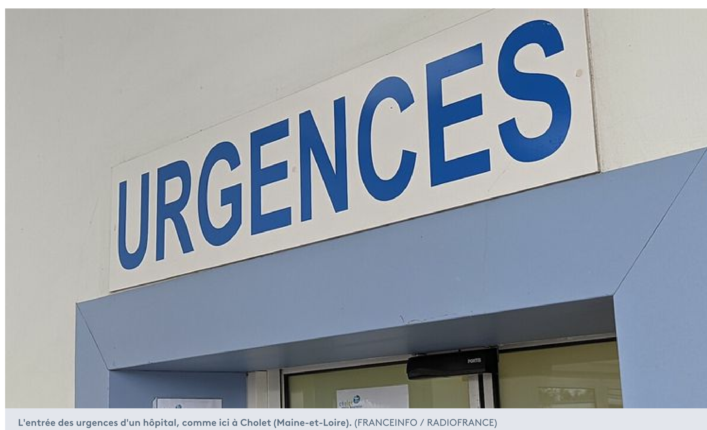
L'entrée des urgences d'un hôpital, comme ici à Cholet (Maine-et-Loire).

"La France est championne de l'hécatombe: 1200 morts du travail par an" peut-on lire sur un post Facebook du leader de la France Insoumise Jean-Luc Mélenchon. Sous cette affirmation figure un diagramme intitulé "La France, leader européen de la mort au travail". Si les chiffres mentionnés sont réels, ils sont à contextualiser.