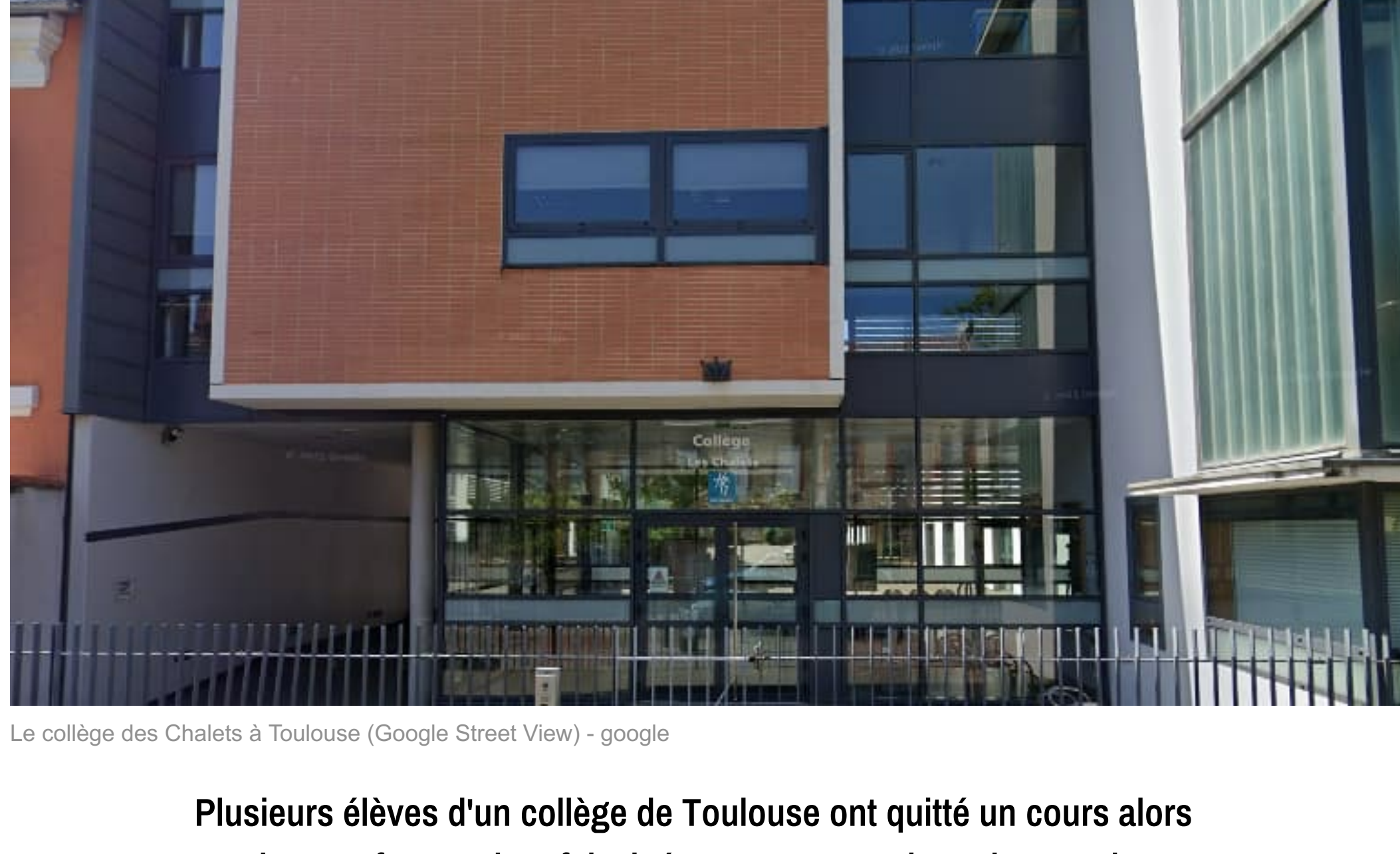
Le collège des Chalets à Toulouse

Plusieurs élèves d'un collège de Toulouse ont quitté un cours alors que leur professeur leur faisait écouter une musique des Beatles en plein Ramadan.