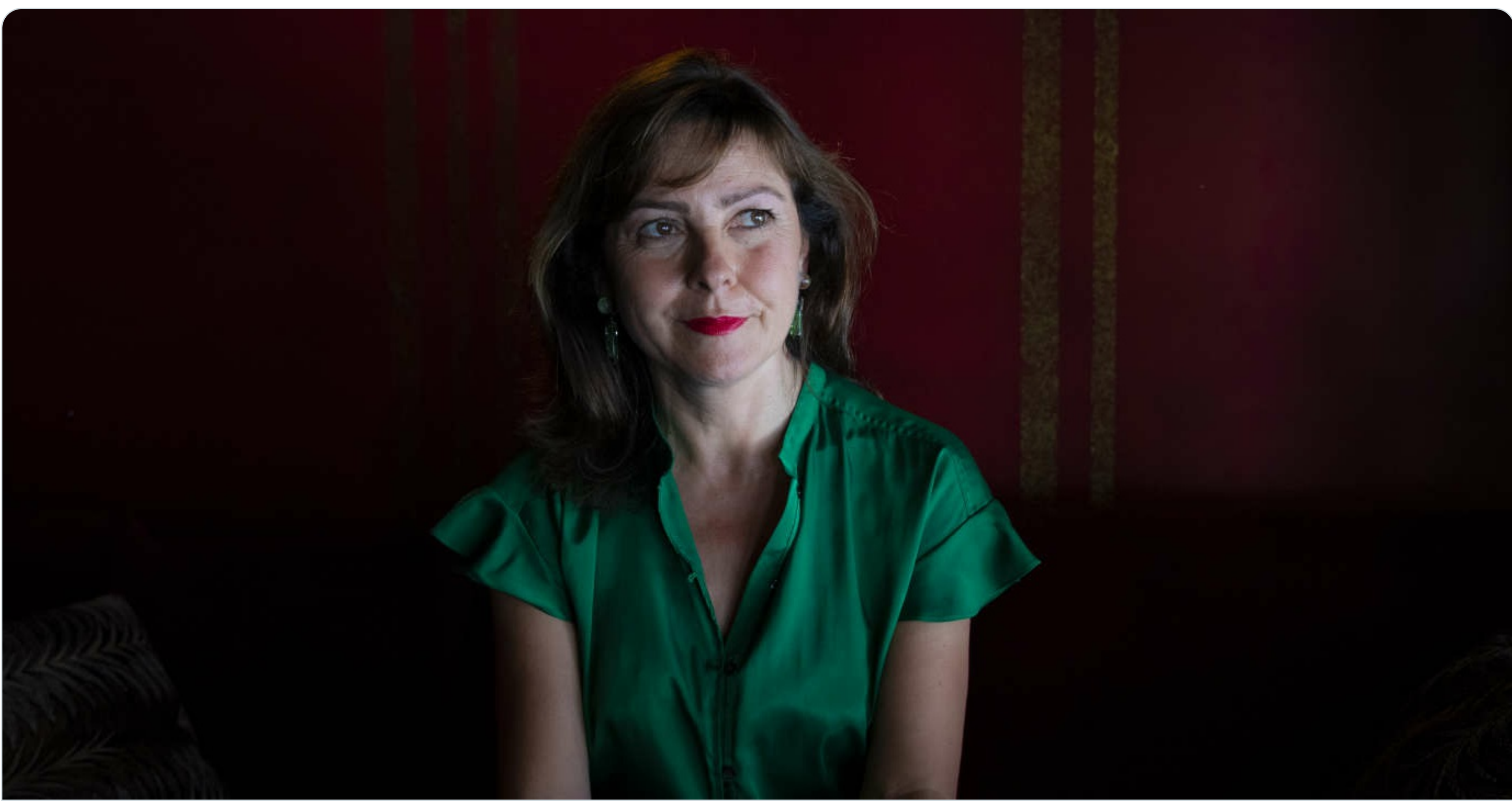
lemonde.fr Législatives 2022 : Carole Delga, la frondeuse socialiste face à la Nupes La présidente de la région Occitanie incarne, au sein du PS, la résistance à la Nouvelle Union populaire écologique et sociale. Forte de ses succès politiques, elle est plus pressée qu'elle ne veut...