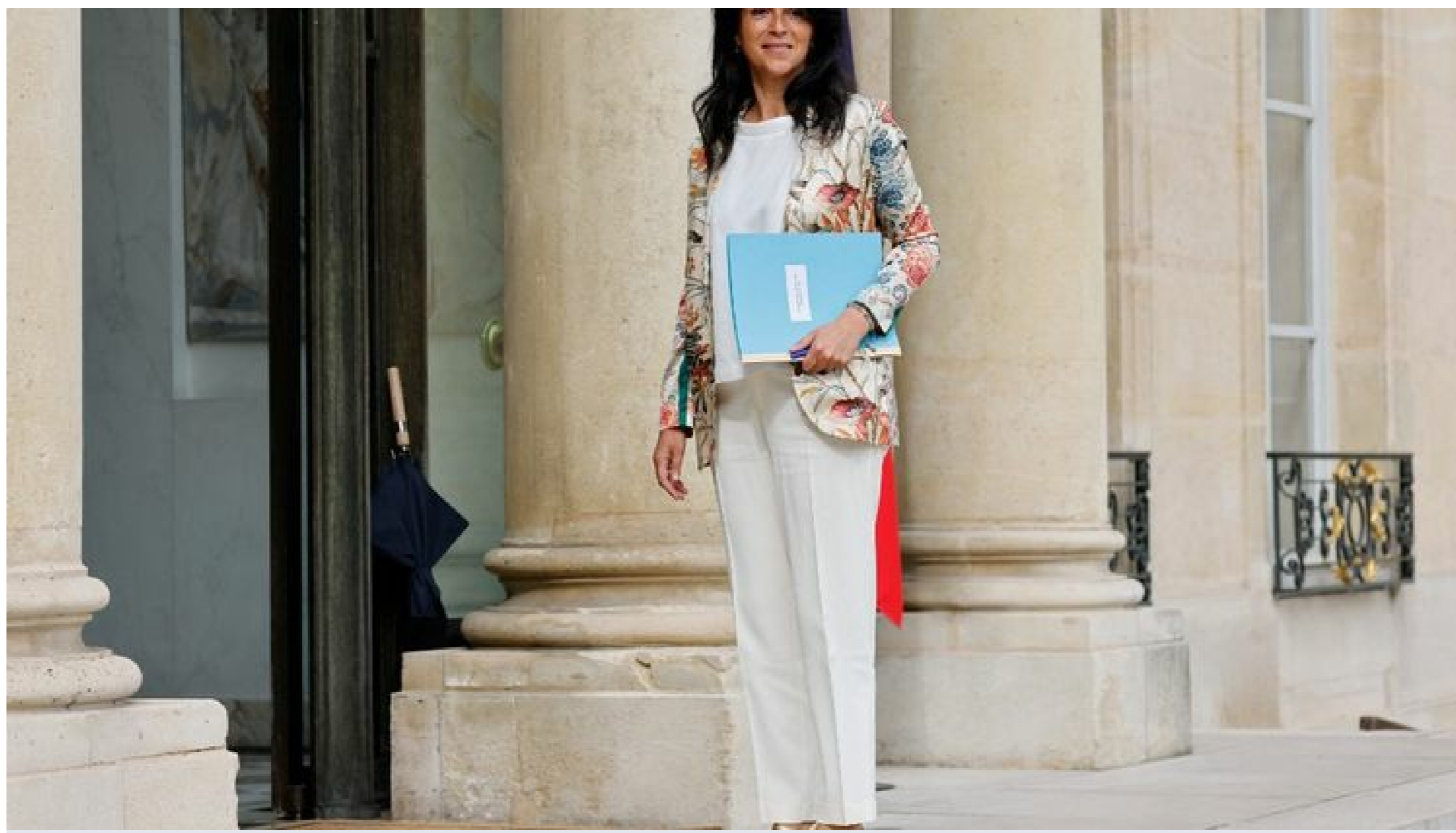
La secrétaire d'Etat et gynécologue Chrysoula Zacharopoulou, le 23 mai 2022 à l'Élysée, à Paris.

La gynécologue et secrétaire d'Etat chargée du Développement, Chrysoula Zacharopoulou, juge, vendredi 24 juin, "inacceptables" les accusations de viols dont elle fait l'objet. "Les accusations graves à mon encontre, portant sur des examens cliniques médicaux réalisés afin de diagnostiquer et de soigner la maladie de mes patientes, sont révoltantes" , a-t-elle précisé dans un communiqué transmis par son avocat.