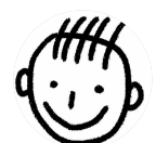
Claquettes Bleues @ClaquettesB · Jun 25