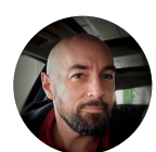
Frédéric Kerneuzet @fkerneuzet · Jun 25