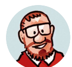
Vincent Valentin @htmlvv

Habitat m'informe que c'est de ma faute si un bureau à 800 € s'abime au bout de 3 mois d'utilisation. Ne pas y poser d'ordinateur ou d'avant-bras sous peine de ne pas respecter le mode d'emploi.