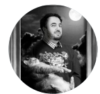
Samy Rabih @SamyRabih · Jun 25