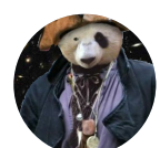
Favouille @blackrhumbar · Jun 25