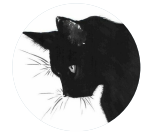
le_chat @lechat87 · Jun 25